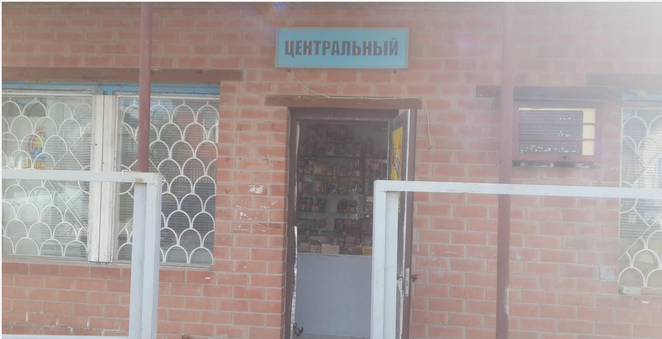
Магазин «Центральный» в селе Дубровка