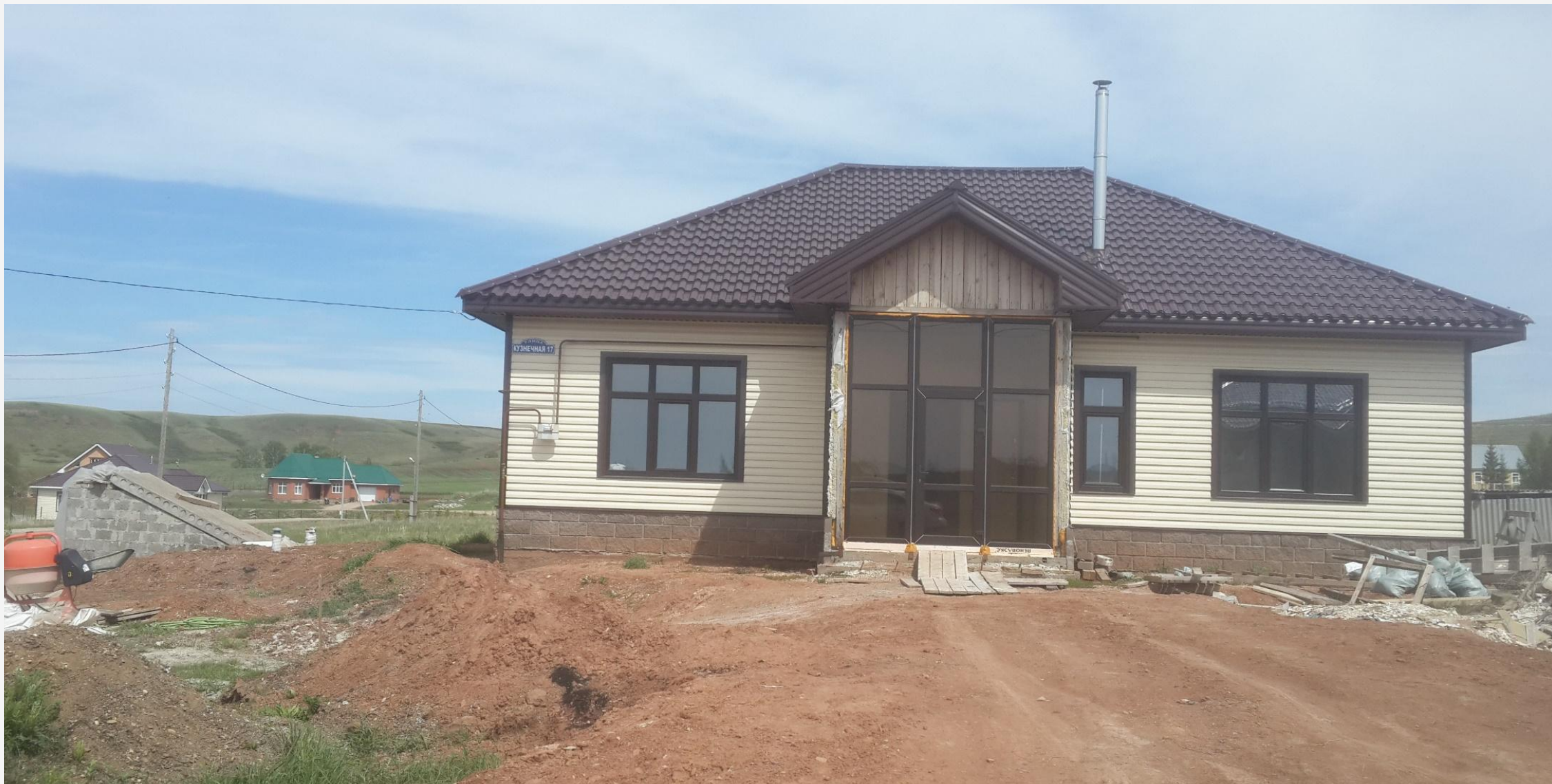
Село Дубровка: новые жилые дома