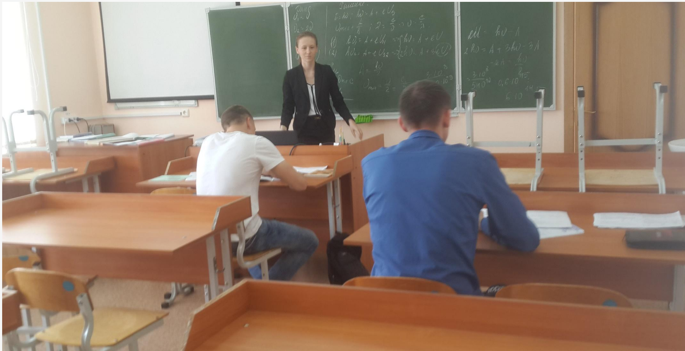
Класс математики и физики в Дубровской общеобразовательной школе