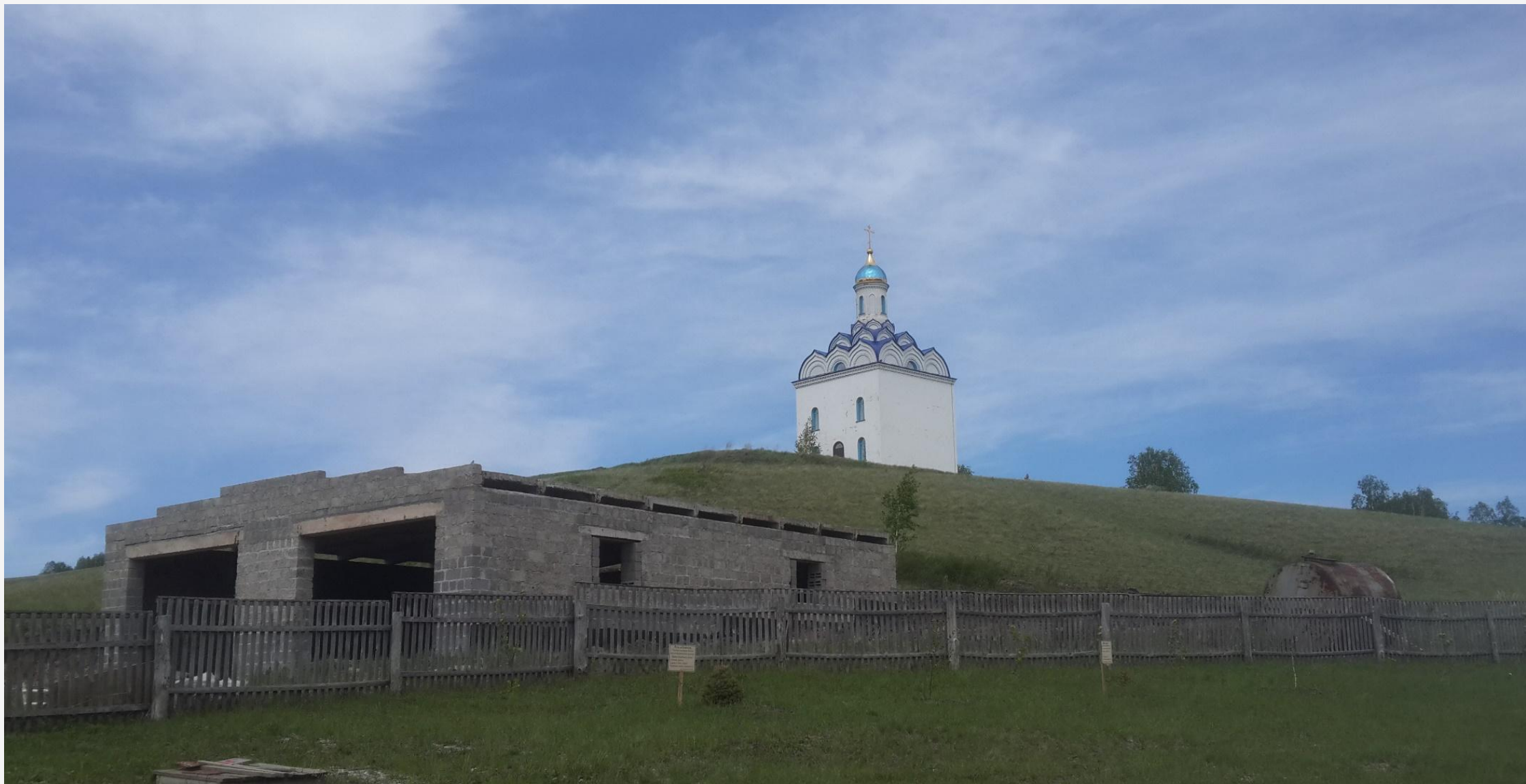
Часовня в селе Дубровка