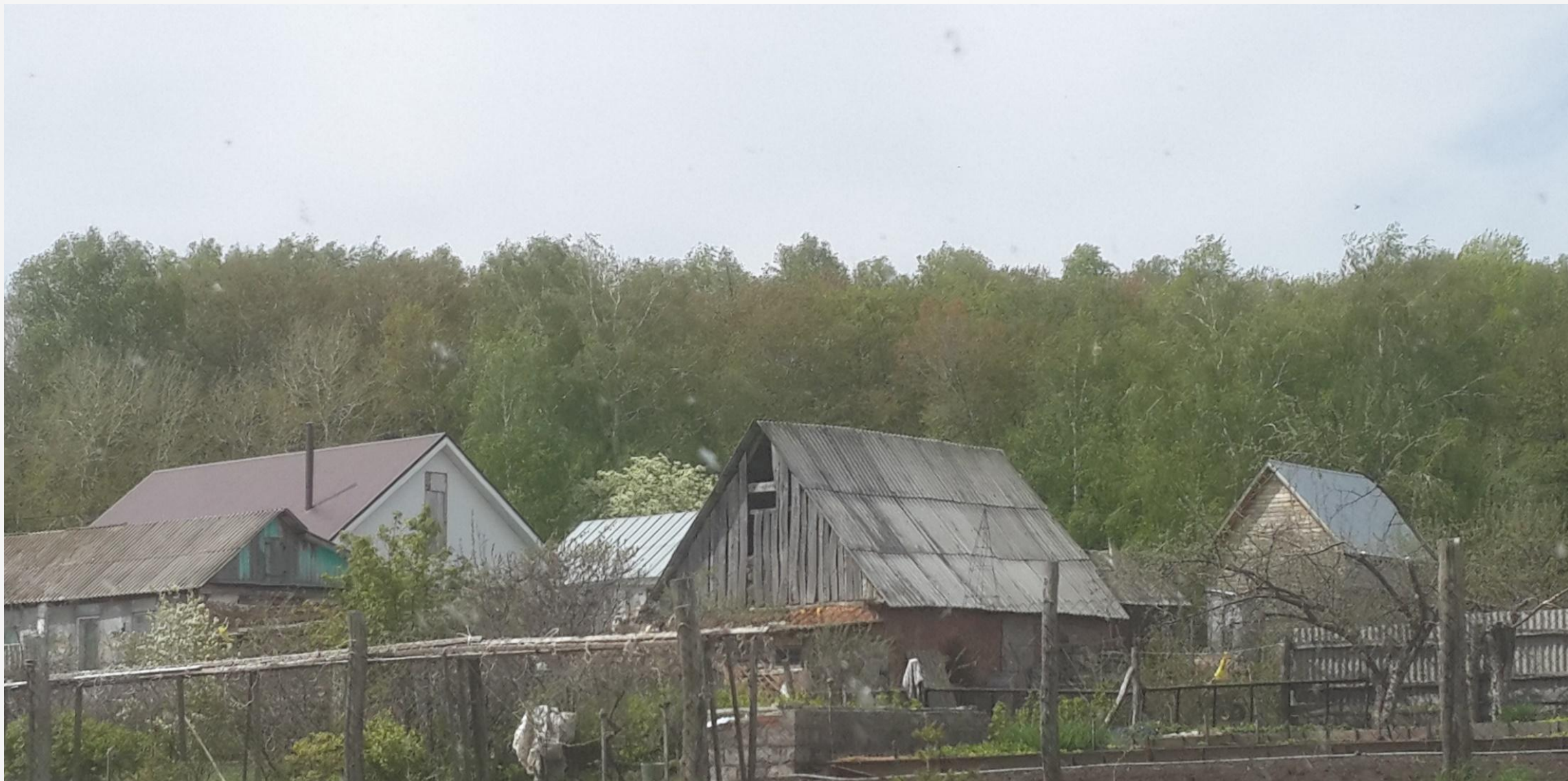
Село Дубровка: жилые дома