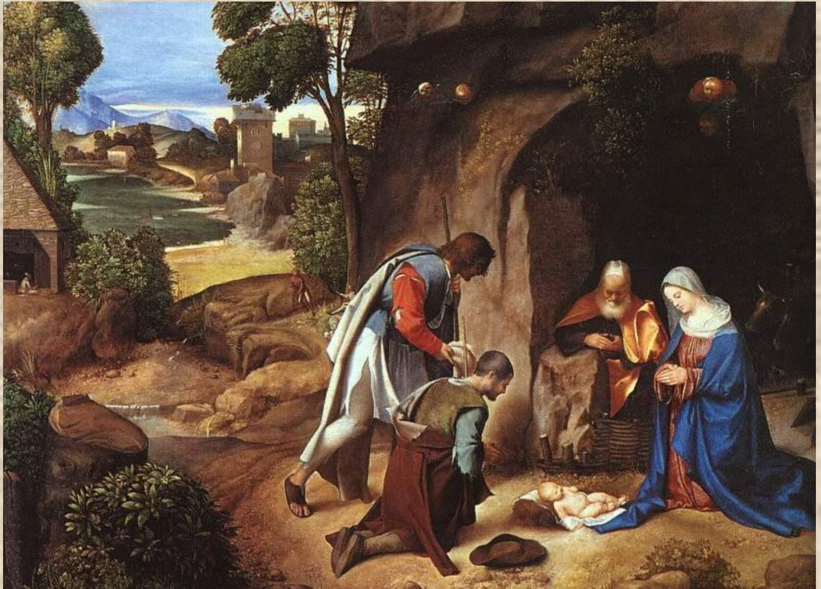
Джорджоне «Поклонение пастухов»