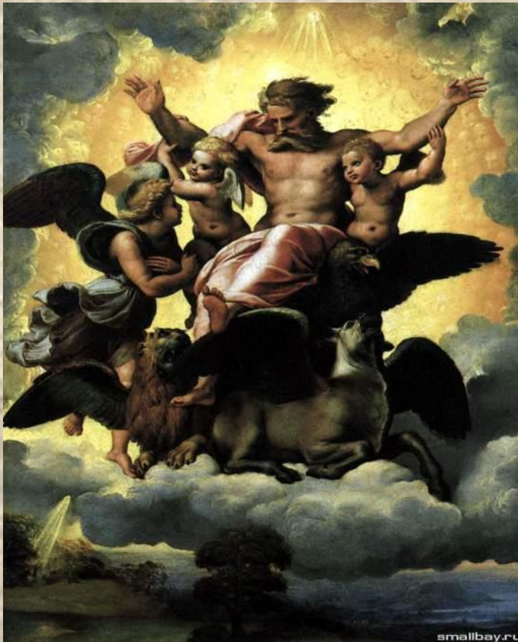
Рафаэль « Видение Иезекииля »