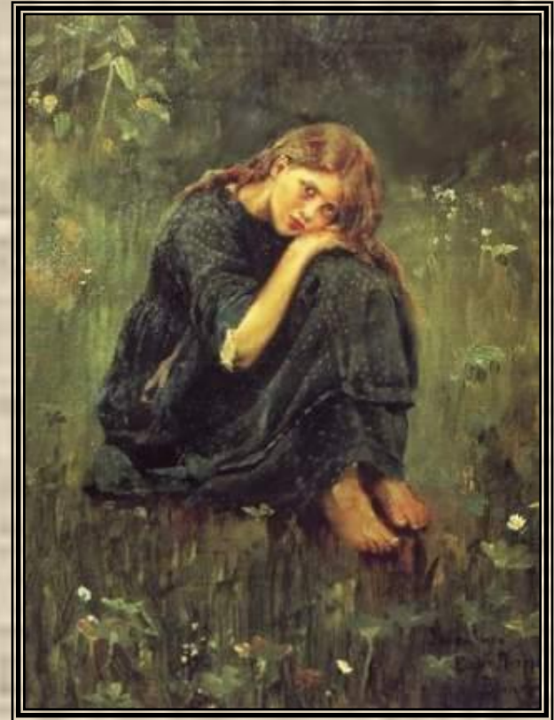
Этюд к «Алёнушке»