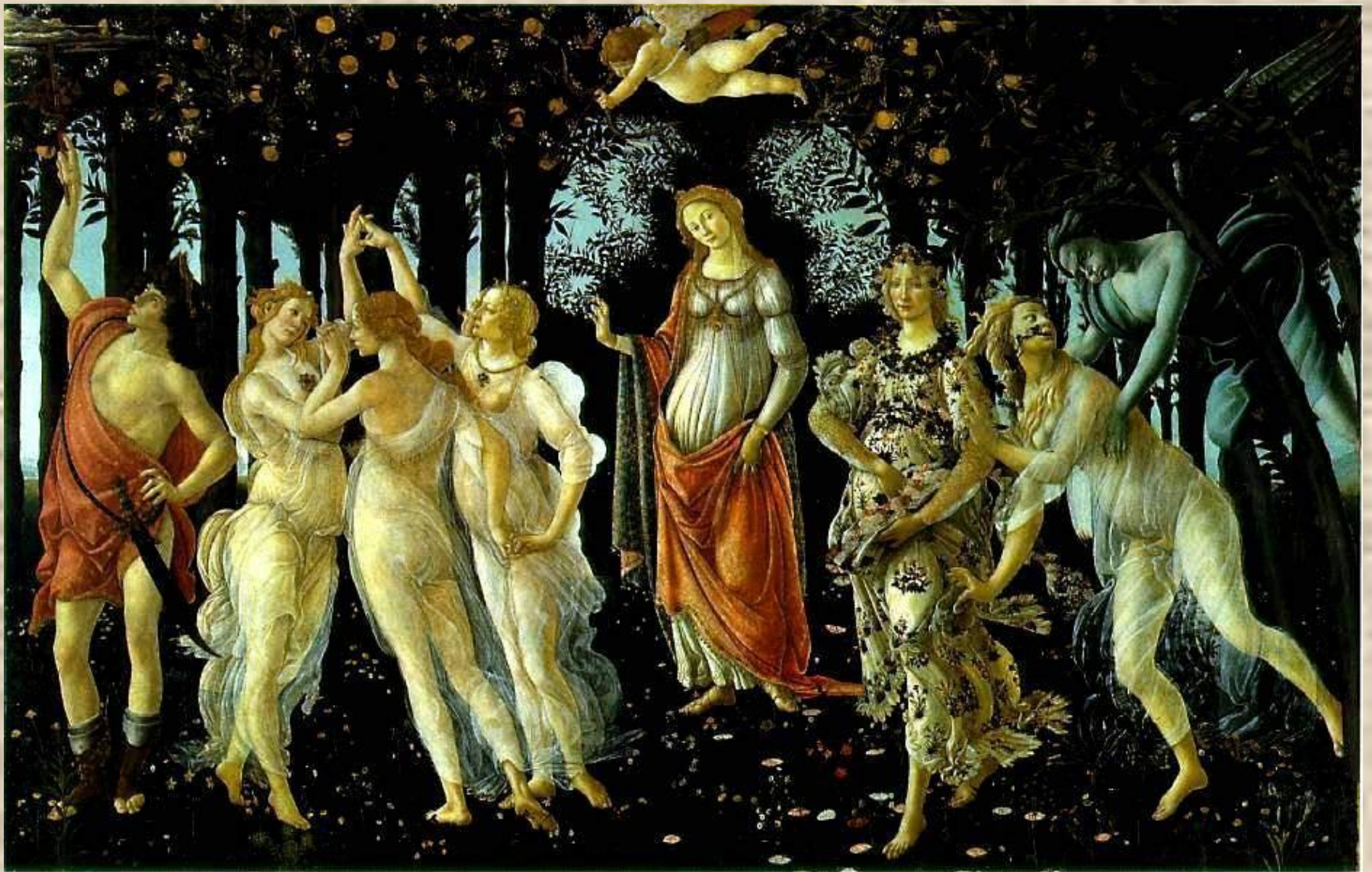
С. Боттичелли «Весна»