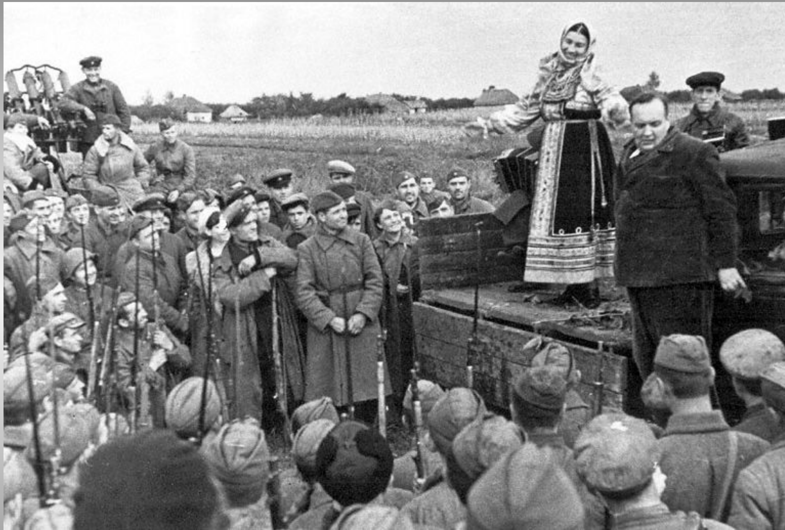
Клавдия Ивановна Шупьженко Концерт Лидии Руслановой