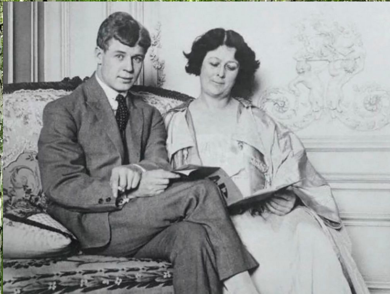
Сергей Есенин с Айседорой Дункан