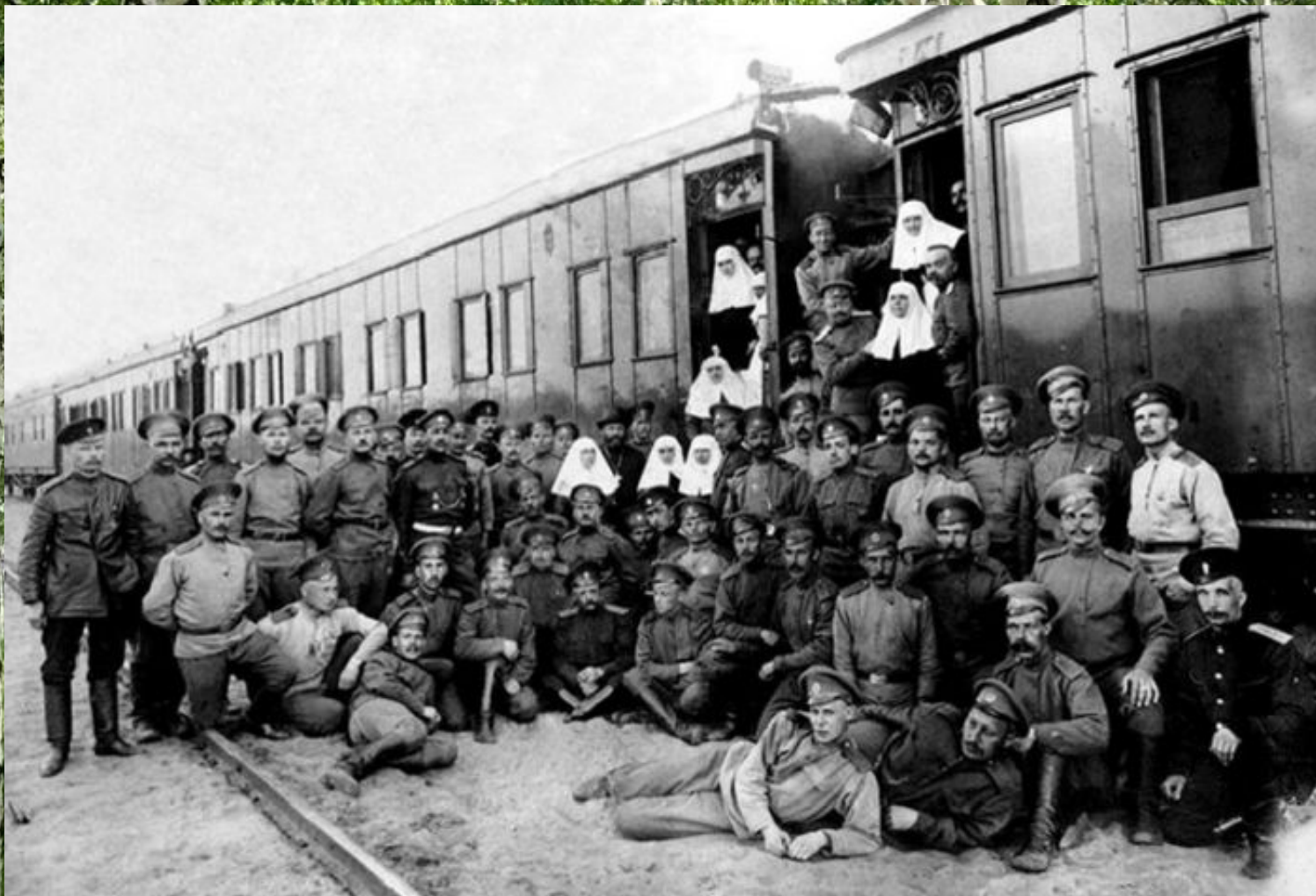
Сергей Есенин среди военнослужащих санитарного поезда № 143.