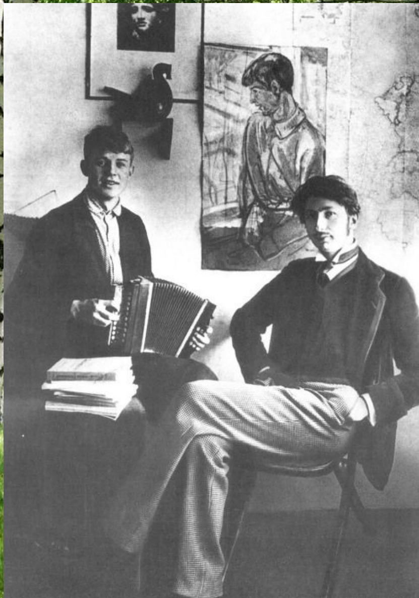
Сергей Есенин и поэт С. Городецкий