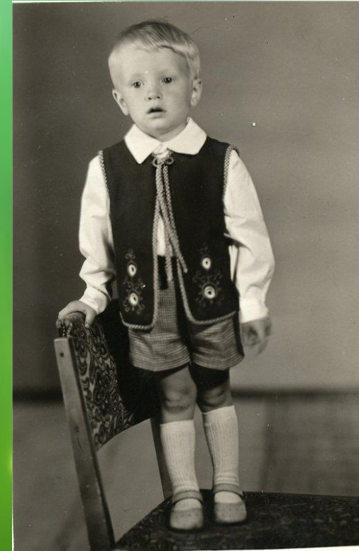
Сергей Есенин в детстве