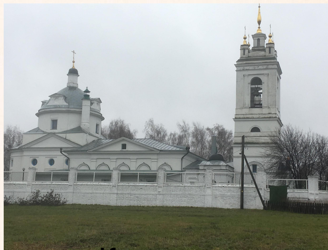
Казанская церковь в Константиново