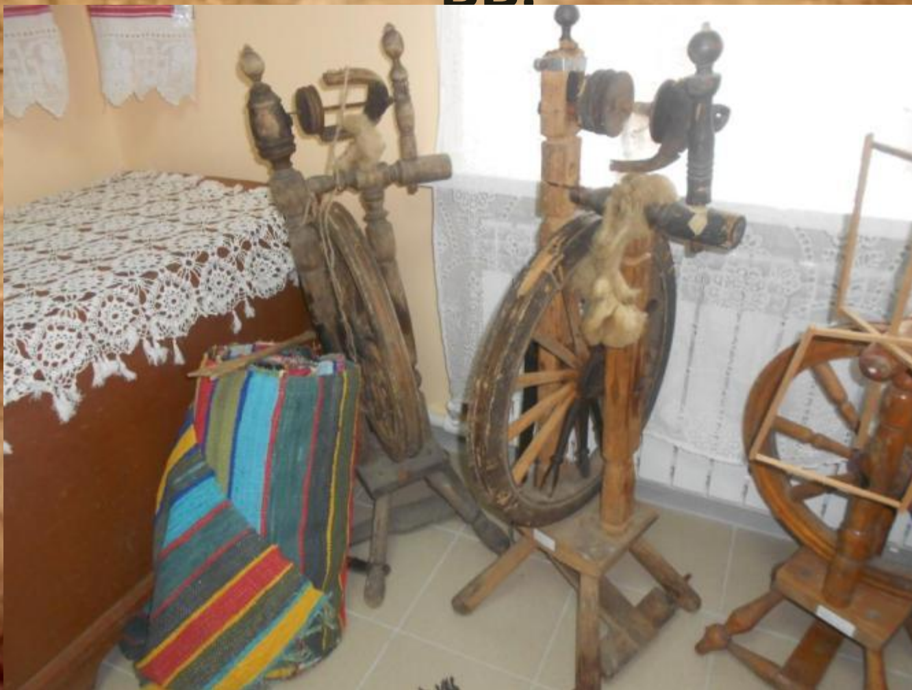
Несколько самопрялок, которые переданы в музей жителями села.