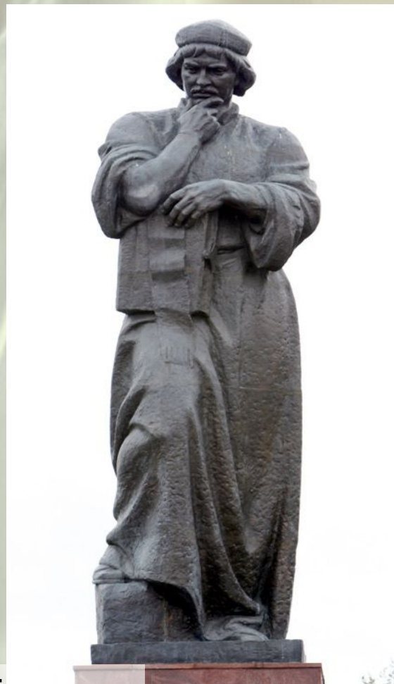
Помнік у Полацку