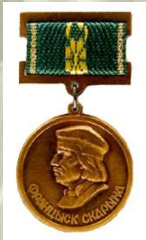
Медаль Францыска Скарыны