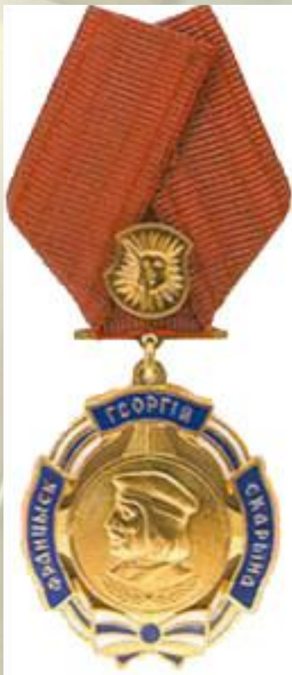
Ордэн Францыска Скарыны