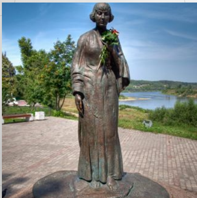
ПАМЯТНИК МАРИНЕ ЦВЕТАЕВОЙ В ГОРОДЕ ТАРУСА НА БЕРЕГУ ОКИ. ОТКРЫТ 8 ОКТЯБРЯ 2006Г.