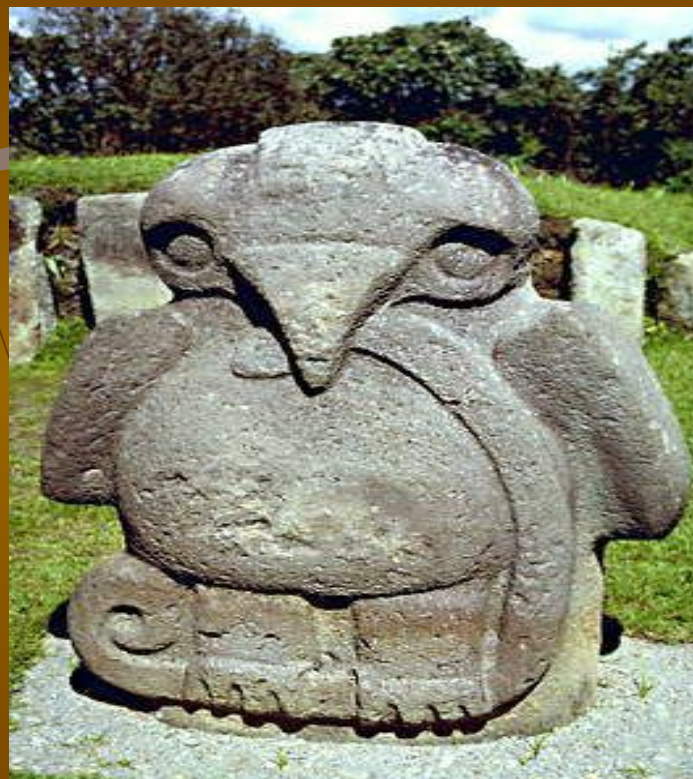
Кам'яна статуя птиці зі змією. Археологічна культура індіанців Сан-Агустін. Ок. 400 м Національний археологічний парк, Сан-Агустін, Колумбія