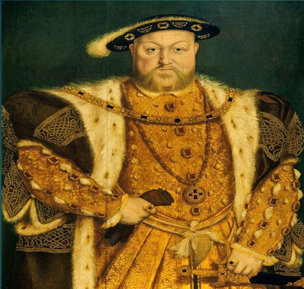
Генрих VIII Тюдор

В Англии Тюдорам приходилось считаться с парламентом. Согласно обычаям английские короли не имели права собирать налоги без их разрешения. Тюдоры предпочитали сотрудничать с парламентом, а не бороться