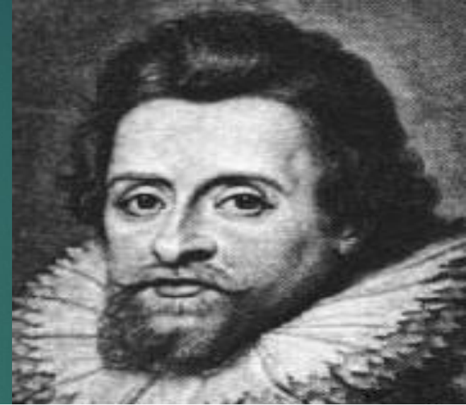
Яков I Стюарт

Генрих Тюдор VIII – 21 раз ( за 37 лет) Дочь Елизавета – 13 раз ( за 45 лет)