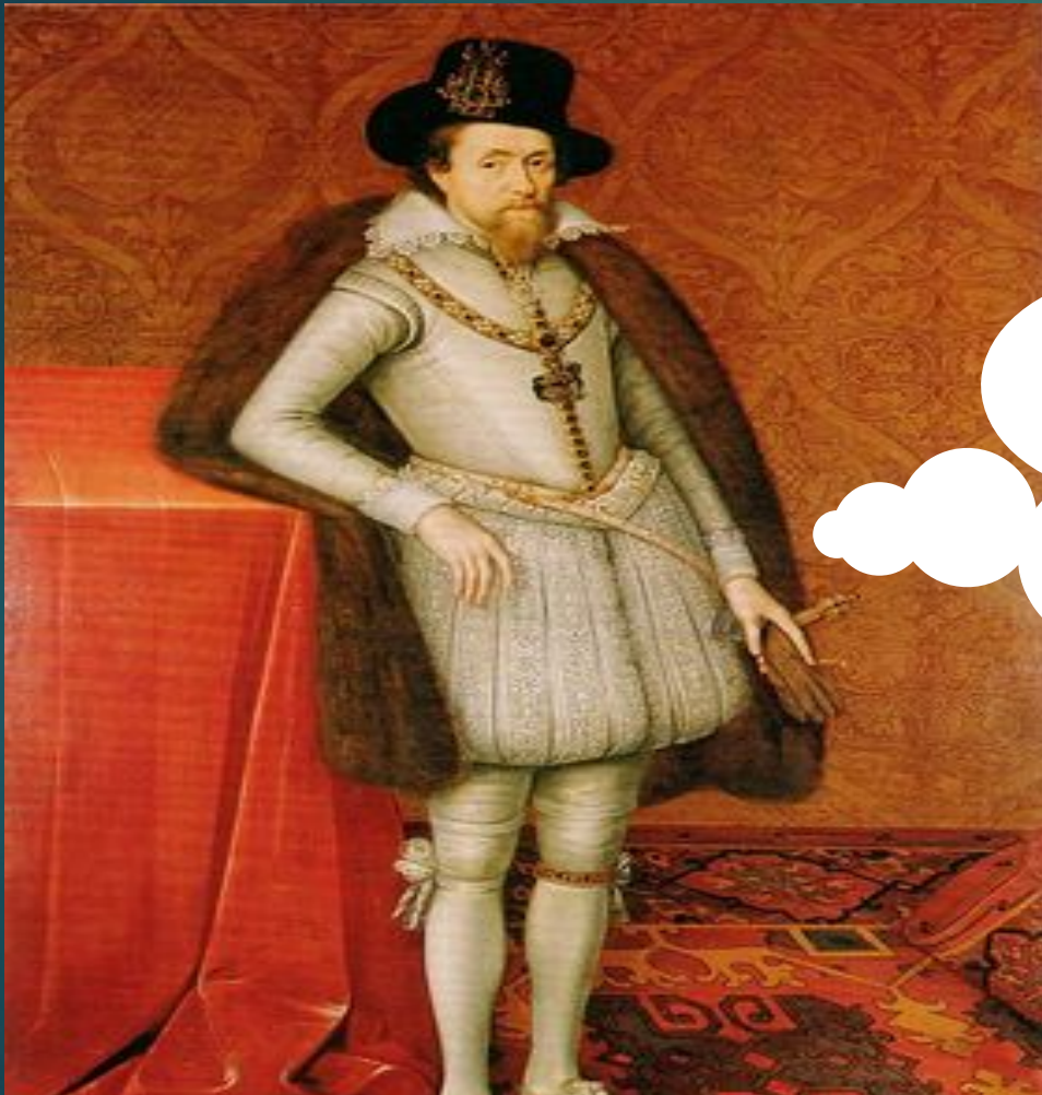
Яков I Стюарт

« Рождённый подданным должен повиноваться »