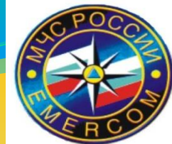
ТАБЕЛЬ ОСНОВНЫХ ОБЯЗАННОСТЕЙ ЛИЧНОГО СОСТАВА ОТДЕЛЕНИЯ КАРАУЛА НА АЦ-40(ЗИЛ-131)НА