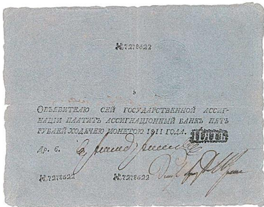
Российская ассигнация 1787 года

Нехватка металла для производства монет-одна из причин появления бумажных денег. Добыча золота и серебра зависит исключительно от развития одной отрасли-горнодобывающей, тогда как потребность в деньгах от развития всей экономики в целом.