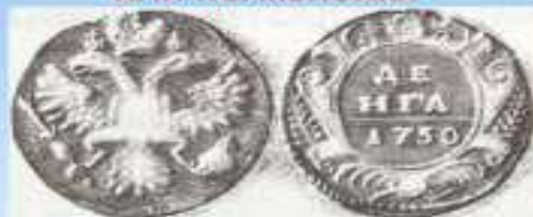
Деньга – ½ копейки или полкопейки