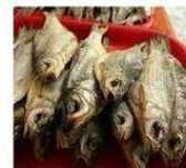
Сушёная рыба (Исландия)