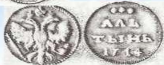
Алтын – 3 копейки