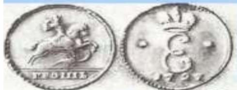
Грош – 2 копейки