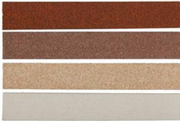
Декоративные элементы на окна и двери

Декоративные элементы на окна и двери , поставляются в комплекте с термопанелями и представляют собой панели из пенополистирола, которые с трёх сторон покрыты слоем цветной мраморной крошки также как и панели . Декоративные элементы изготавливаются по размерам заказчика, в том числе полукруглые.