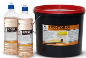
Клей для Т- профиля и грунтовка глубокого проникновения

Декоративные элементы на окна и двери , поставляются в комплекте с термопанелями и представляют собой панели из пенополистирола, которые с трёх сторон покрыты слоем цветной мраморной крошки также как и панели . Декоративные элементы изготавливаются по размерам заказчика, в том числе полукруглые.