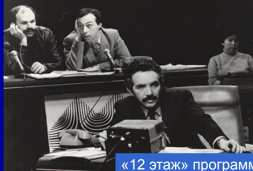
«12 этаж» программа Э. Сагалаева