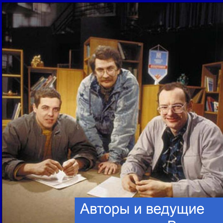
Авторы и ведущие программы «Взгляд»