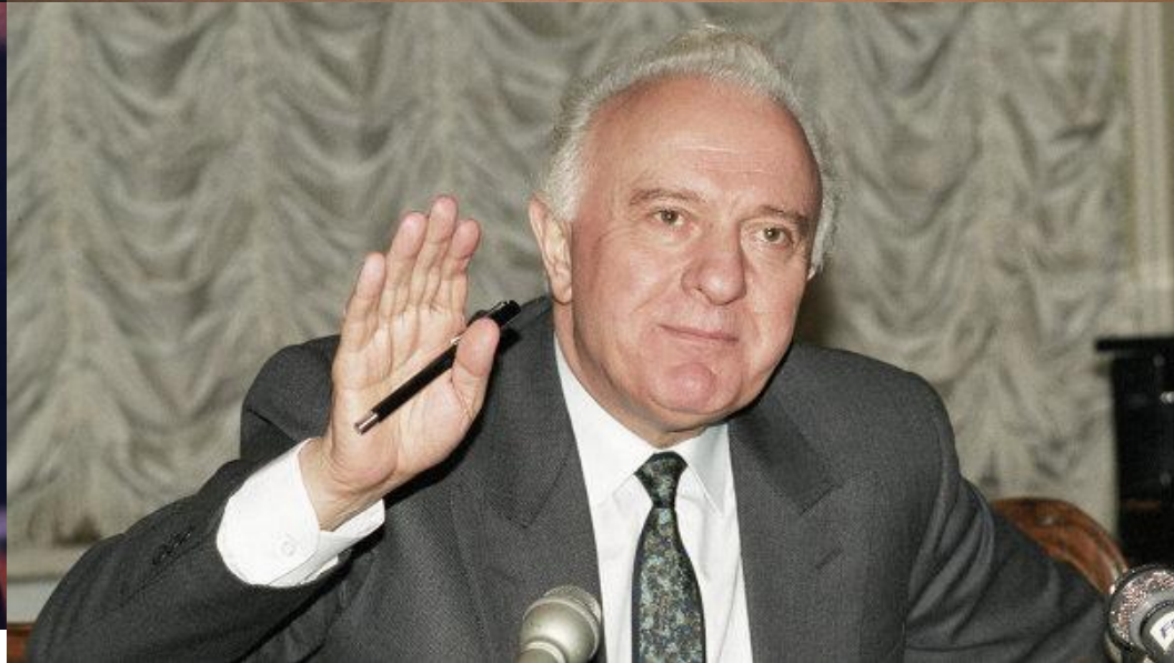
Эдуард Амвросиевич Шеварднадзе