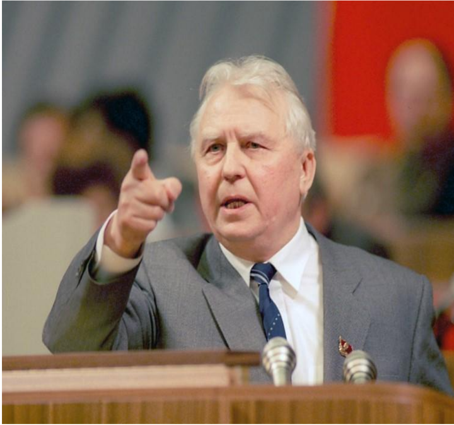
Егор Кузьмич Лигачёв