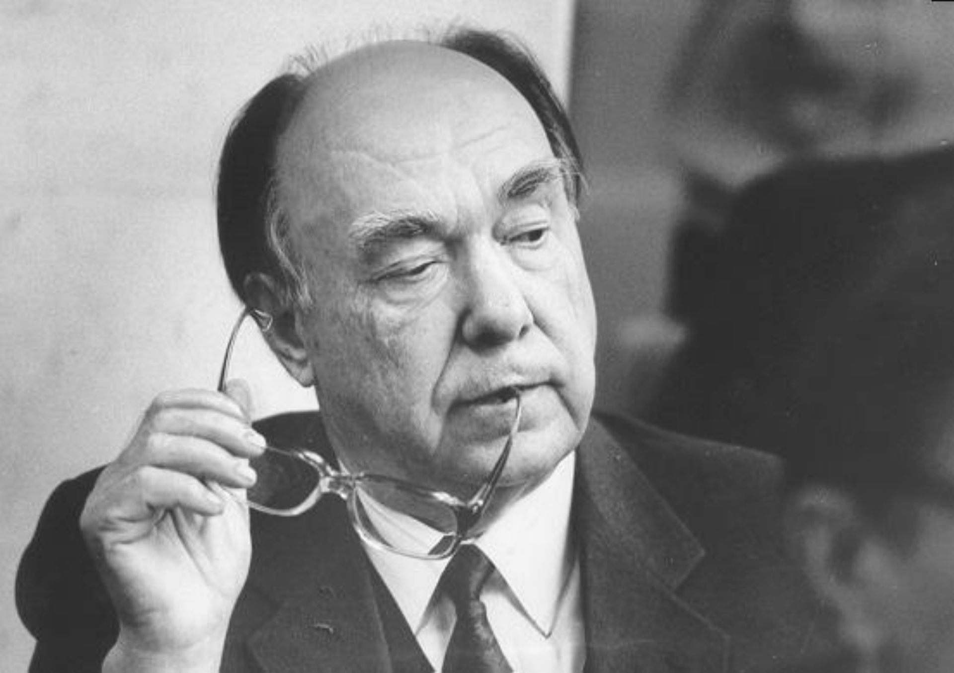
Александр Николаевич Яковлев