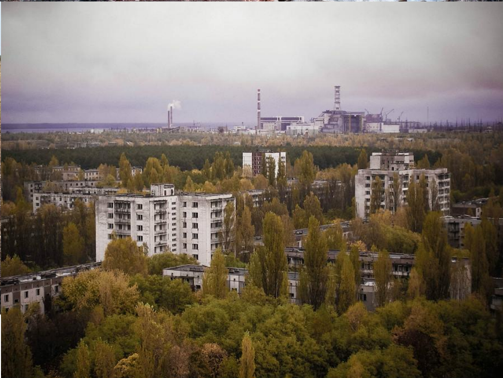
Зона отчуждения Чернобыльской АЭС. Город Припять