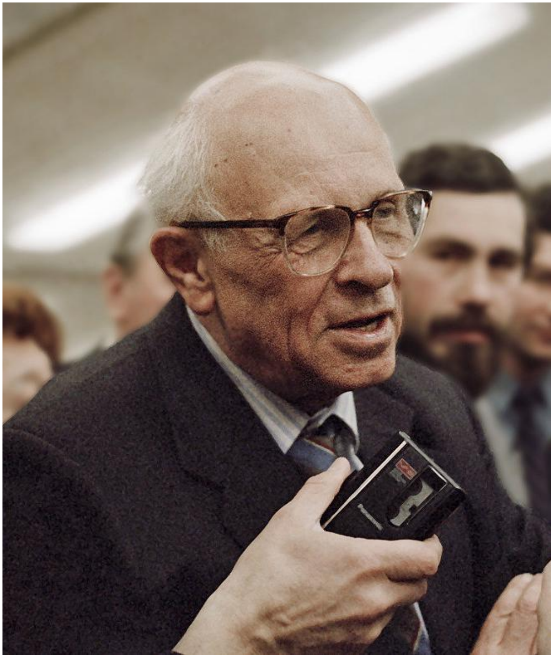
Андрей Дмитриевич Сахаров