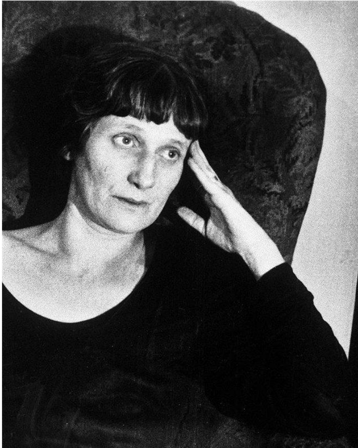
Анна Андреевна Ахматова