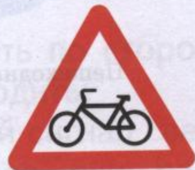
Пересечение с велосипедной дорожкой