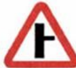
2.3.2 Примыкание второстепенной дороги