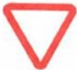
2.4 Уступите дорогу