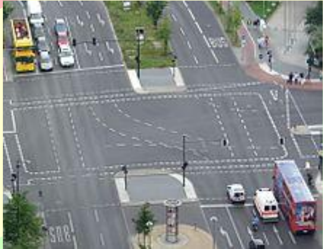
Перекрёсток с множеством дорожных разметок

Дорожная разметка (маркировка) — маркировка на покрытии автомобильных дорог. Она служит для сообщения определённой информации участникам дорожного движения. Дорожные разметки появились в начале XX века на асфальтовых и бетонных дорогах.