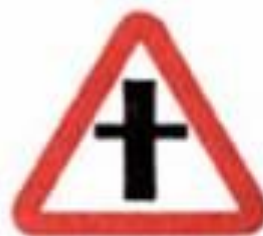
2.3.1 Пересечение со второстепенной дорогой