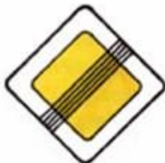
2.2 Конец главной дороги