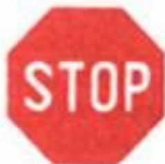
2.5 Движение без остановки запрещено