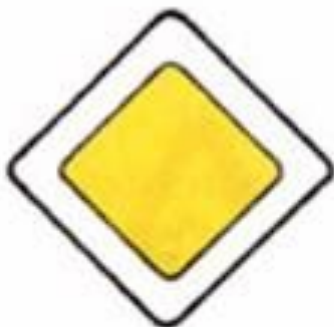
2.1 Главная дорога