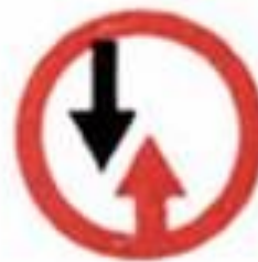
2.6 Преимущество встречного движения