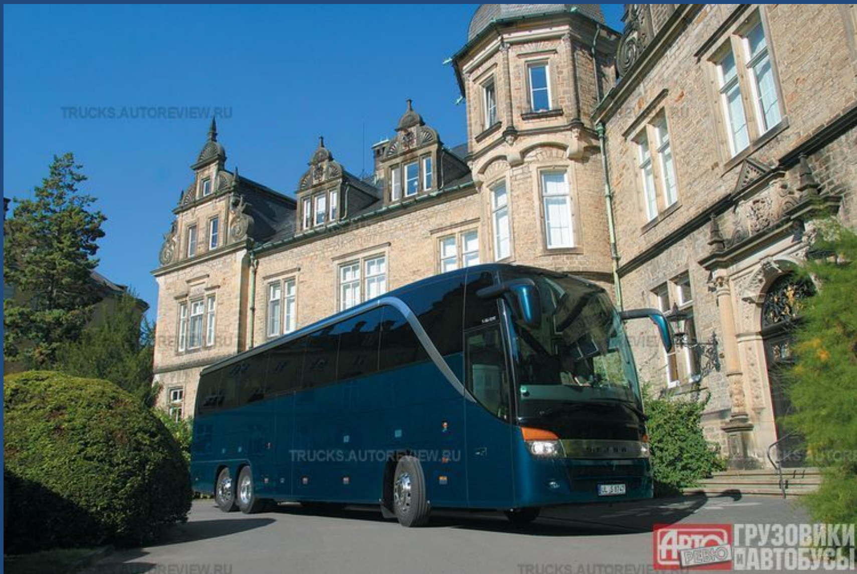
Setra S416 HDH