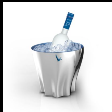
ВЕДРА для охлаждения