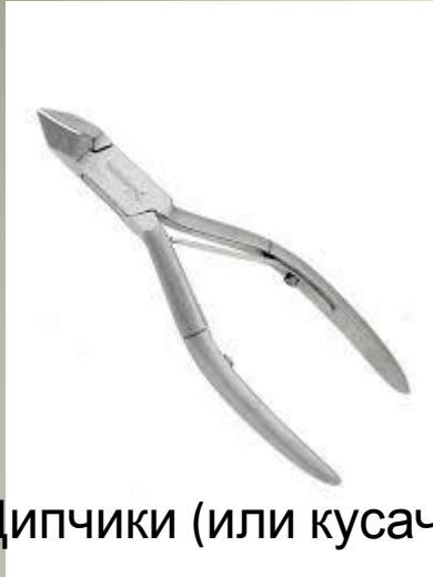
Щипчики (или кусачки)