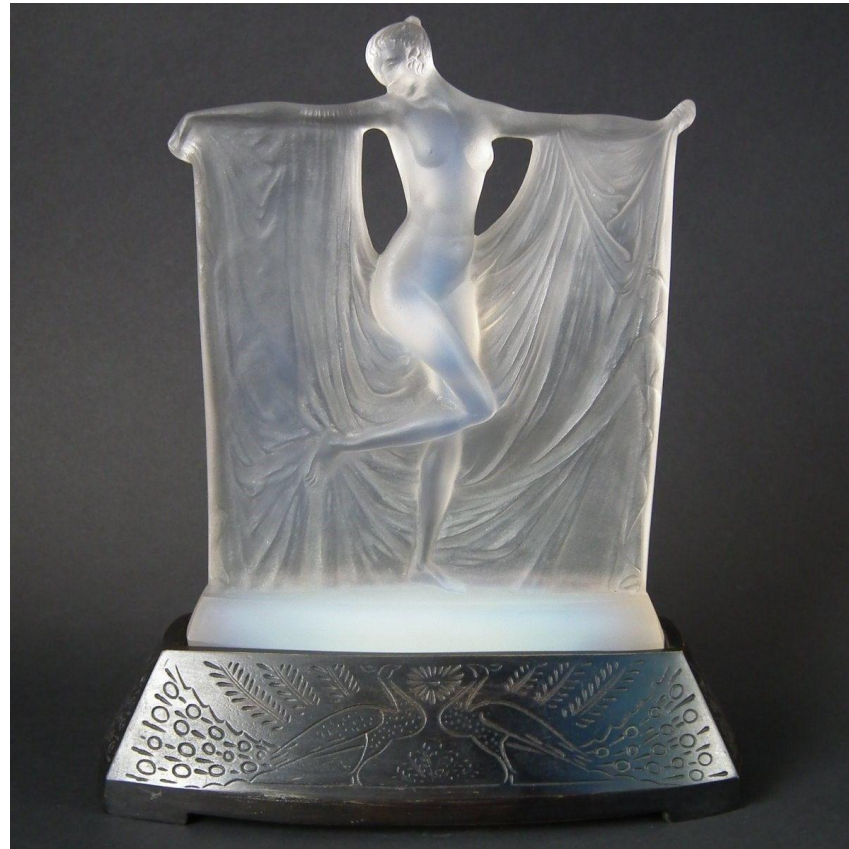
Хрустальная скульптура Таис