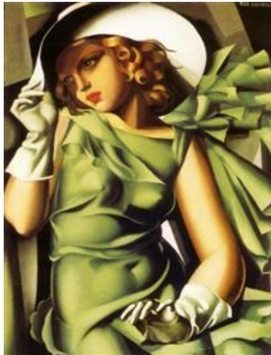
Девушка с перчатками 1929 год.