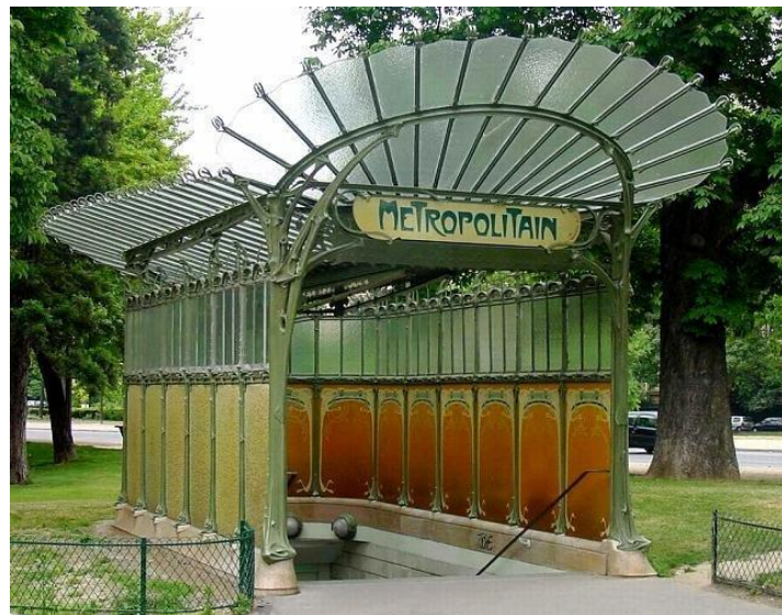
Входные павильоны парижского метрополитена