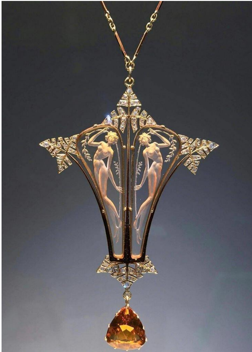
Кулон ар нуво