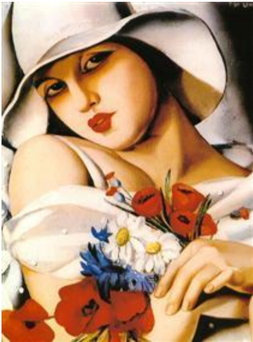
В середине лета 1938 год.