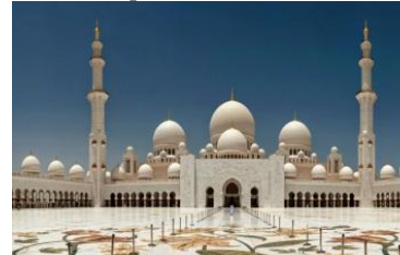
IX конференция ОАЭ, Абу-Даби апрель 2018