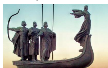
IV конференция Украина, Киев апрель 2014