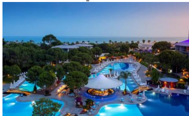
VII конференция Турция, Белек