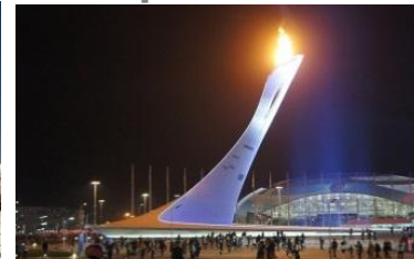
X конференция Сочи апрель 2019