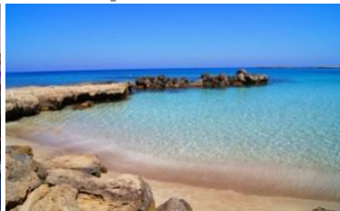
VIII конференция Кипр