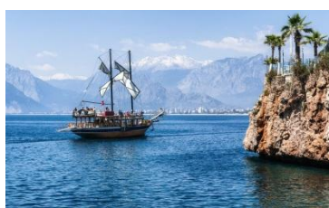
III конференция Турция, Анталия апрель 2013