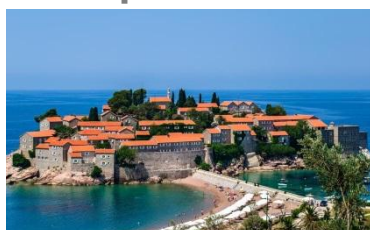
II конференция Черногория, Будва ноябрь 2012