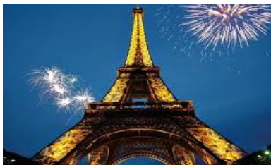
VI конференция Франция, Париж май 2016