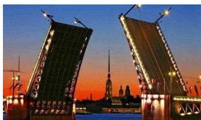
XI конференция Санкт - Петербург