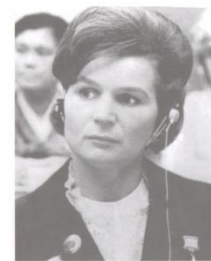
ТЕРЕШКОВА Валентина Владимировна

В статье имеется краткая биография первой женщины-космонавта Валентины Владимировны Терешковой. Перечисляются достижения, награды и звания.