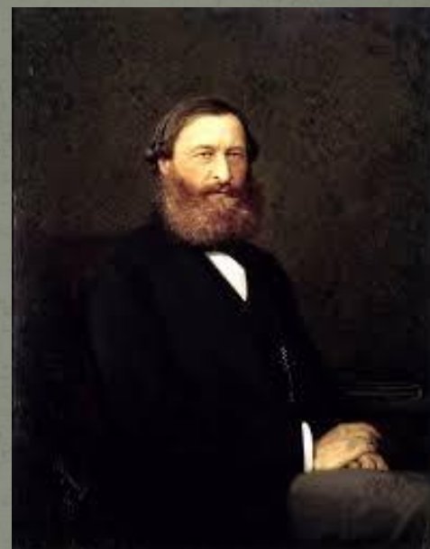
Ю. Ф. Самарин