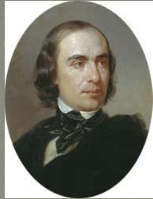
Т.Н. Гранковский (21 марта 1813 г -16 октября 1855 г)