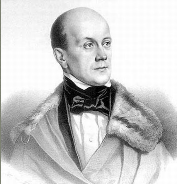
П.Я. Чаадаев (7 июня 1794 – 14 апреля 1856 г )