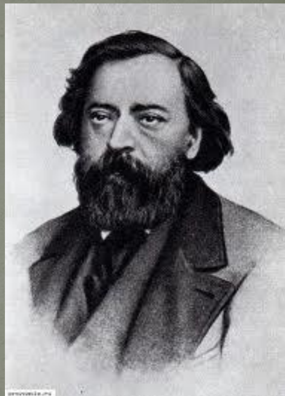
А.И.Герцен (6 апреля 1812 г – 21 января 1870 г)