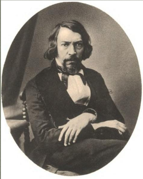
А. С. Хомяков (1 мая 1804 г- 5 октября 1860 г.)