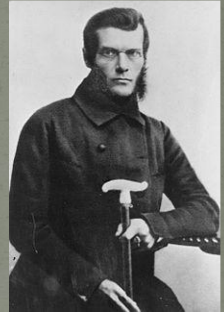
И.В. Киреевский (22 марта 1806 г -11 июня 1856 г.)