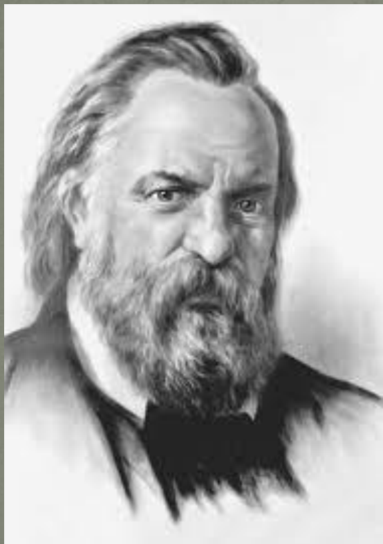
Н.П.Огарев (6 декабря 1813 г -12 июня 1877 г )