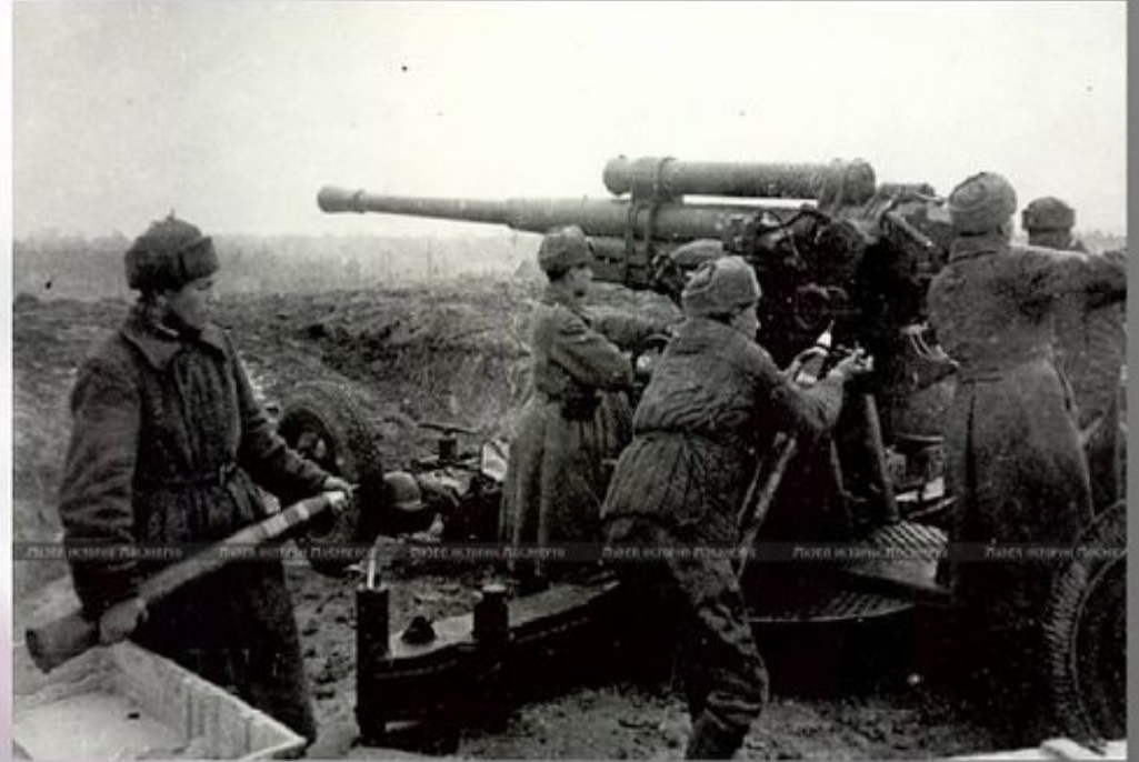
Тульская оборонительная операция продолжалась с 24 октября 1941 по 5 декабря 1941. Наиболее упорные бои за город Тулу развернулись 30 и 31 октября.