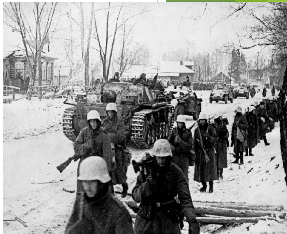
«Тайфун» операция 1941.