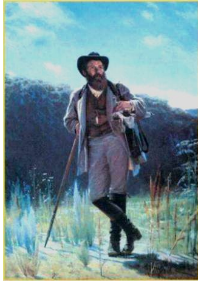
И Крамской Портрет художника И. Шишкина

Для изображения фигуры человека в полный рост следует выбрать вертикальный формат.