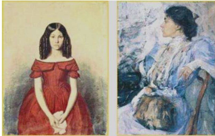
П. Федотов Портрет Н. Фешин Портрет неизвестной

Обычно фигуру или голову человека размещают на холсте таким образом, чтобы вокруг оставалось свободное место и изображение не упиралось в раму. Вид лица, когда ты смотришь на него сбоку, называется профиль , прямо называется анфас .