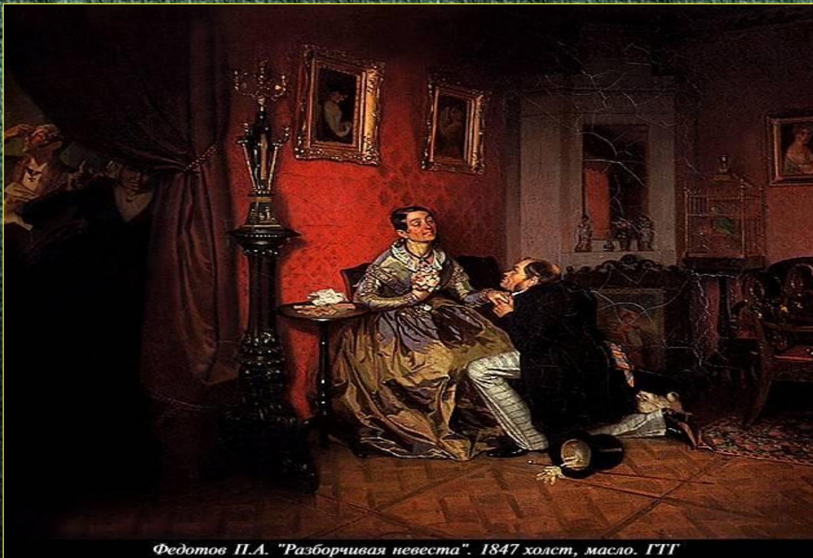
Федотов П.А. "Разборчивая невеста". 1847 холст, масло. ГТГ