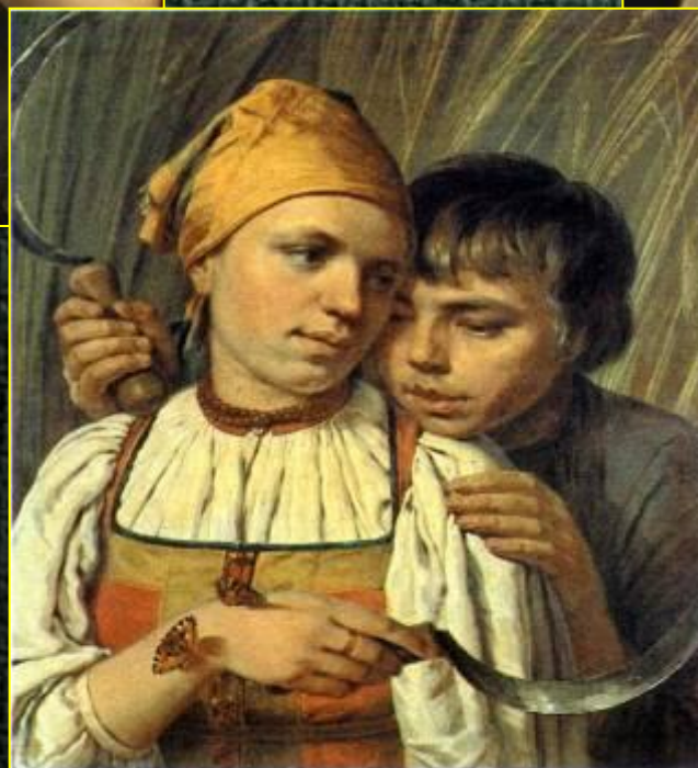
А. Г. Венецианов «Жница»