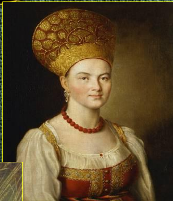
И. П. Аргунов. Портрет крестьянки в русском costume.