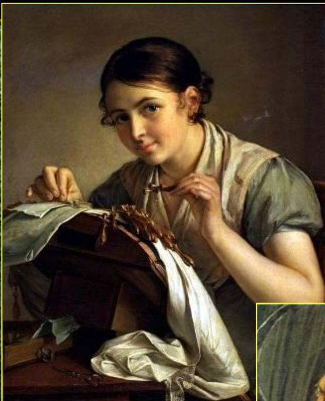
В. А. Тропинин. «Кружевница».