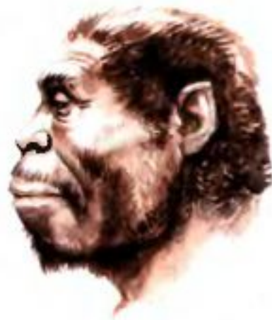
Рис. 7. Питекантроп