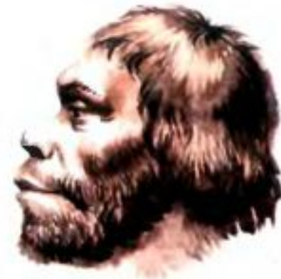
Рис. 8. Неандерталец