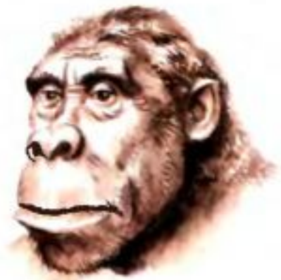
Рис. 6. Австралопитек