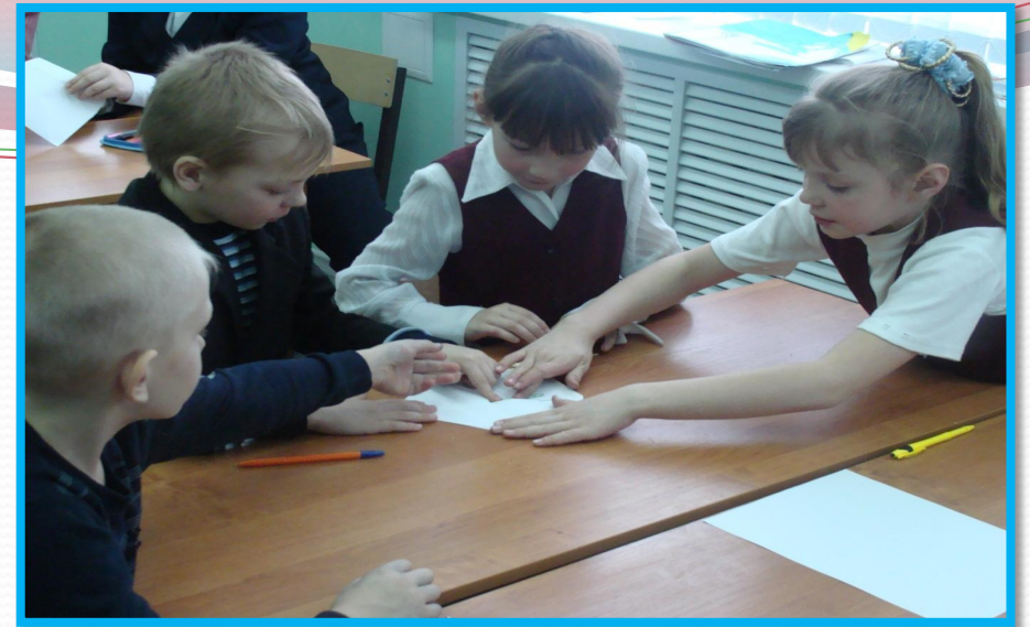
ДИАГНОСТИКА УЧАСТНИКОВ ПРОЕКТА