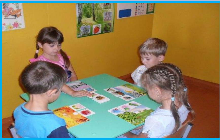
ИГРА-ПУТЕШЕСТВИЕ «РОСТКИ ДОБРА»