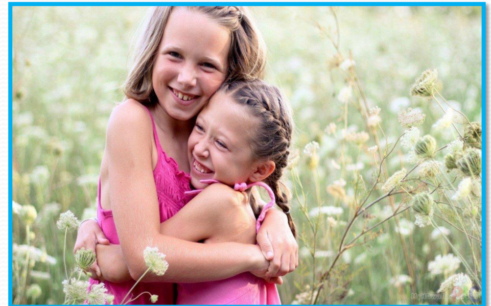
ФЛЕШМОБ «ТВОРИ ДОБРО»