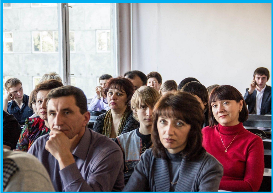
КЛАССНЫЕ ЧАСЫ И РОДИТЕЛЬСКИЕ СОБРАНИЯ