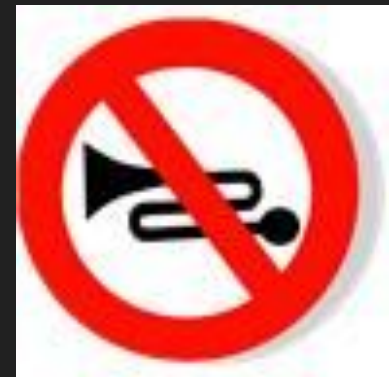
Подача звукового сигнала запрещена