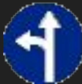
Движение прямо или налево