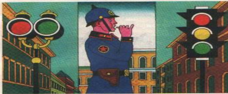
День рождения светофора

Первый светофор появился в Англии, в центре Лондона в 1868 году. Это было что-то вроде газового фонаря.