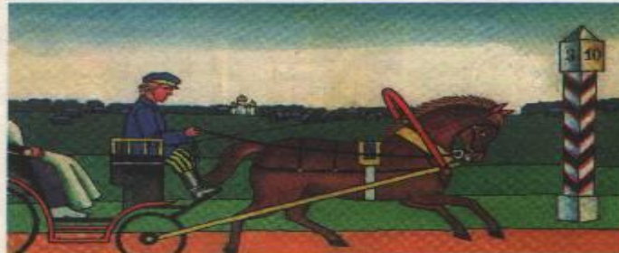
Когда возникли дорожные знаки

Особым языком «разговаривает» улица. На этом дорожном языке с водителями и пешеходами «разговаривают» улицы всех стран мира.