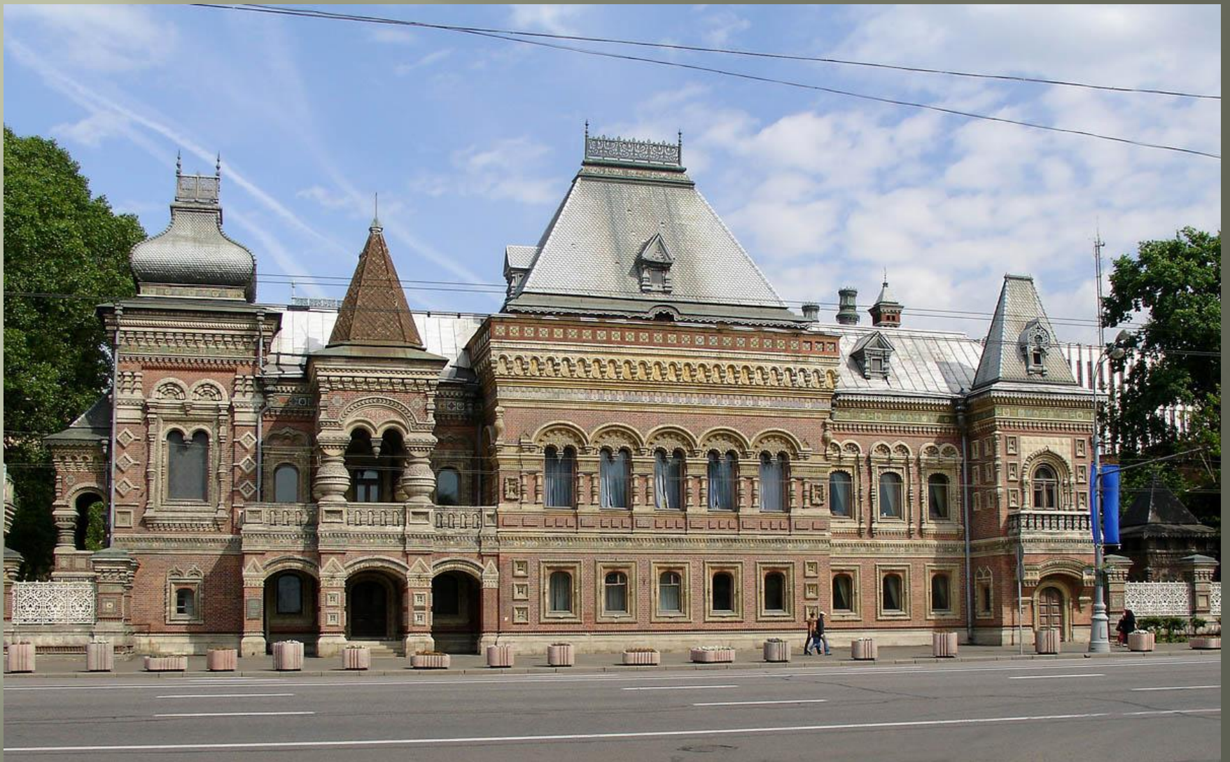
Дом Игумнова (1888—1895) в Москве — один из наиболее ярких образцов стиля. Архитектор Николай Поздеев