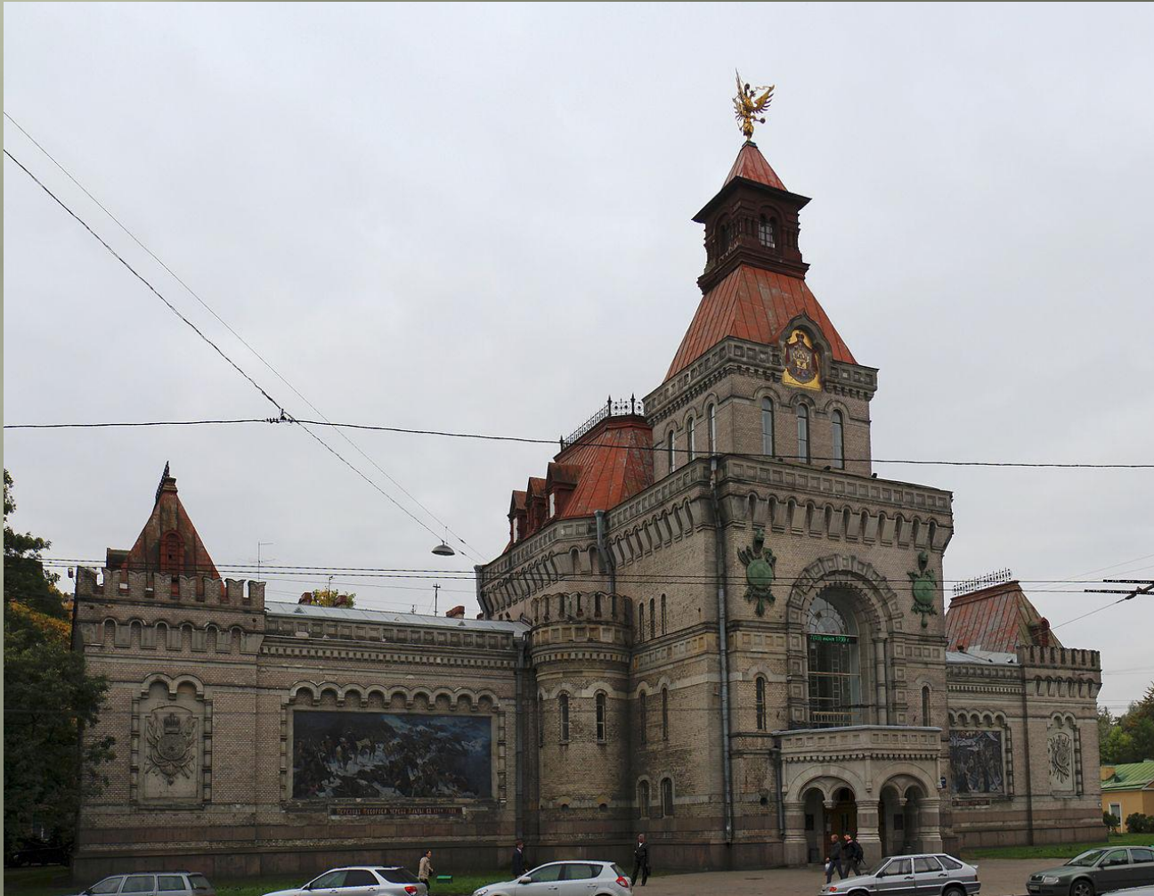
Государственный мемориальный музей А. В. Суворова в Санкт-Петербурге. А. И. фон Гоген при участии Г. Д. Гримма

В начале XX века вся совокупность явлений в архитектуре XIX века, связанная с поисками русской национальной самобытности, стала называться «псевдорусский стиль» — в противоположность «неорусскому стилю». Наряду с определением «псевдорусский», уже имеющим оценочный характер, для обозначения тех же явлений стало употребляться и название с ещё более отрицательным оттенком — «ложнорусский стиль»