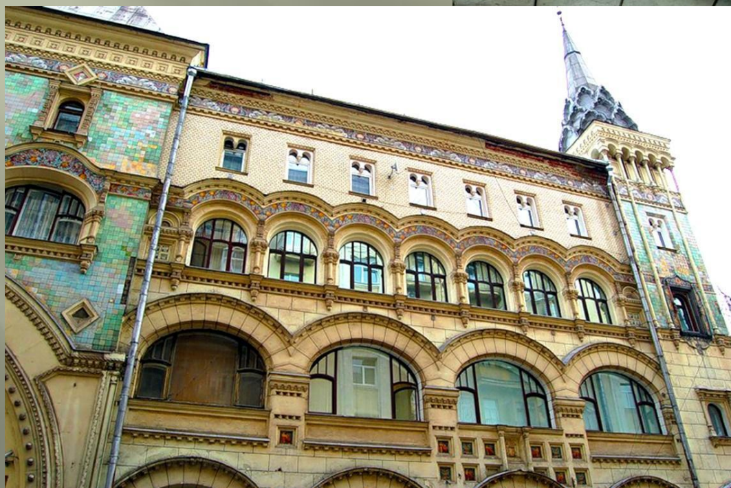
Саввинское подворье. Архитектор Иван Кузнецов