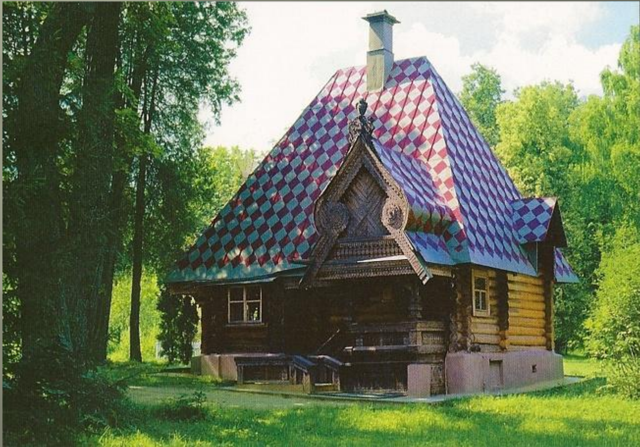
"Избушка на курьих ножках". По проекту Васнецова. 1883 г. Абрамцево

В начале 1870-х годов народнические идеи пробудили в художественных кругах повышенный интерес к народной культуре, крестьянскому зодчеству и русской архитектуре XVI—XVII вв. Одной из самых ярких построек псевдорусского стиля 1870-х годов стал «Терем» Ивана Ропета в Абрамцево под Москвой (1873). Это направление распространилось вначале в архитектуре деревянных выставочных павильонов и небольших городских домов, а затем в монументальном каменном зодчестве.