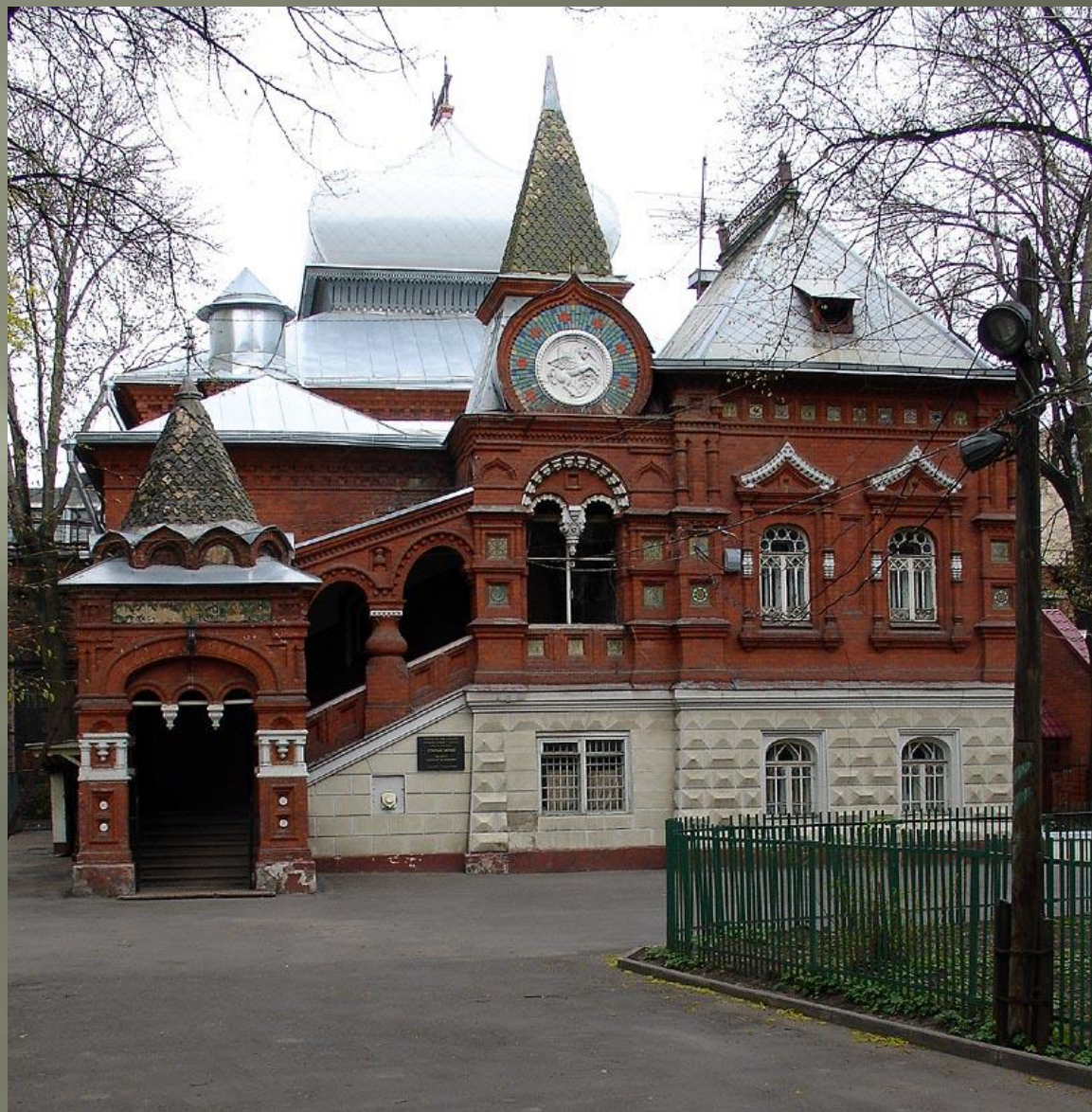
Особняк Щукина в Москве, ныне - Государственный биологический музей имени К. А. Тимирязева. Б. В. Фрейденберг

Псевдорусский стиль или русский стиль (включает русско-византийский стиль) — условное общее наименование нескольких различных по своим идейным истокам эклектических направлений в русской архитектуре XIX — начала XX веков, основанное на использовании традиций древнерусского зодчества и народного искусства, а также ассоциируемых с ними элементов византийской архитектуры.