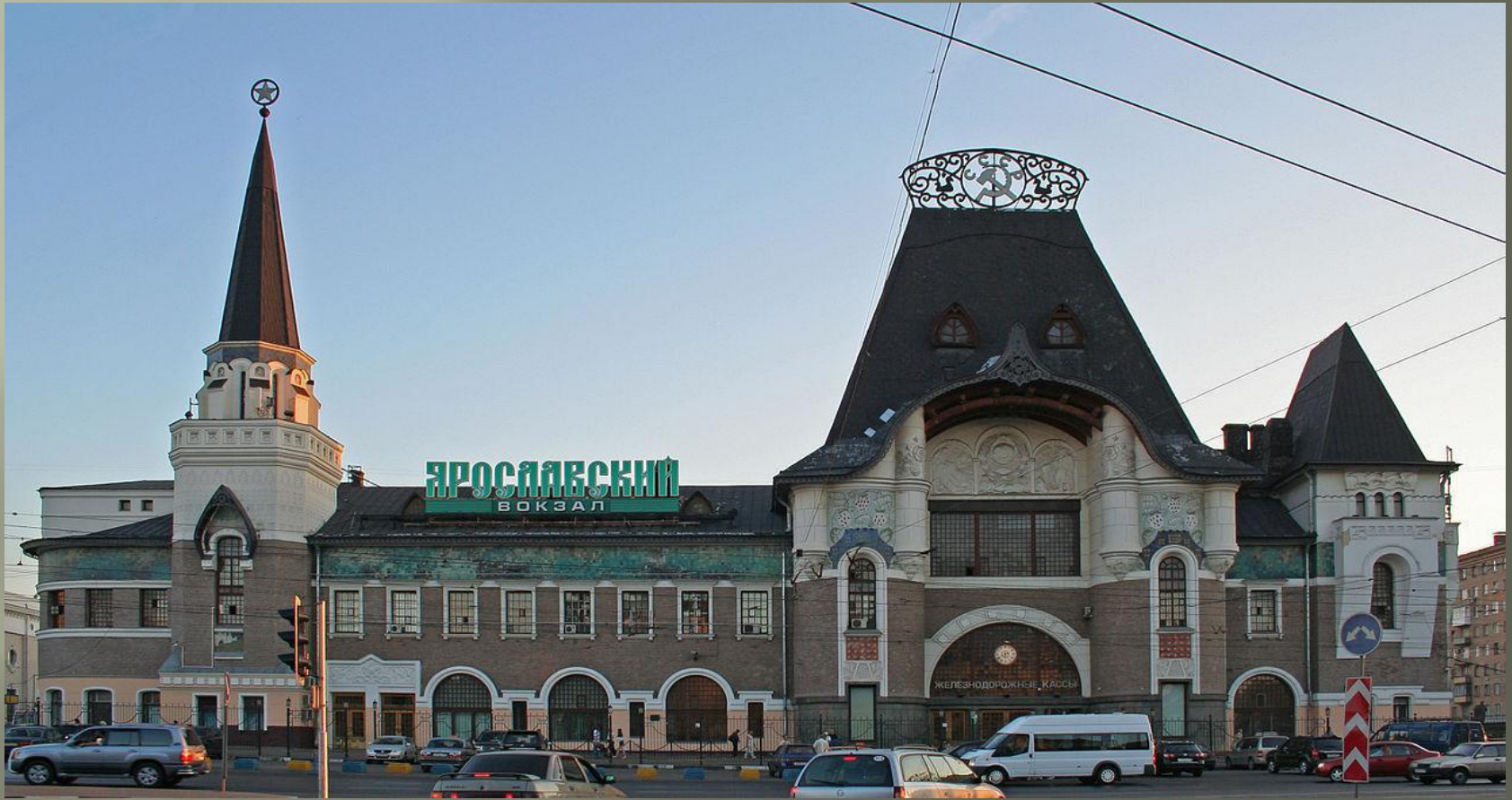
Ярославский вокзал в Москве - сочетание псевдорусской архитектуры с приёмами модерна. Ф.О. Шехтель

Д. В. Сарабьянов считает, что исследователи архитектуры справедливо разделяют русский и неорусский стили: «Действительно, граница между ними — это линия, разделяющая эклектику и модерн»