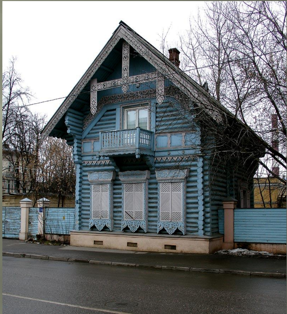
Погодинская изба в Москве

Для другого направления псевдорусского стиля, возникшего под влиянием романтизма и славян офильства, характерны постройки, использующие произвольно истолкованные мотивы древнерусской архитектуры. В рамках данного направления были возведены многие постройки Алексея Горностаева. Ярким примером этого направления является построенная в Москве на Девичьем поле деревянная «Погодинская изба» Николая Никитина.