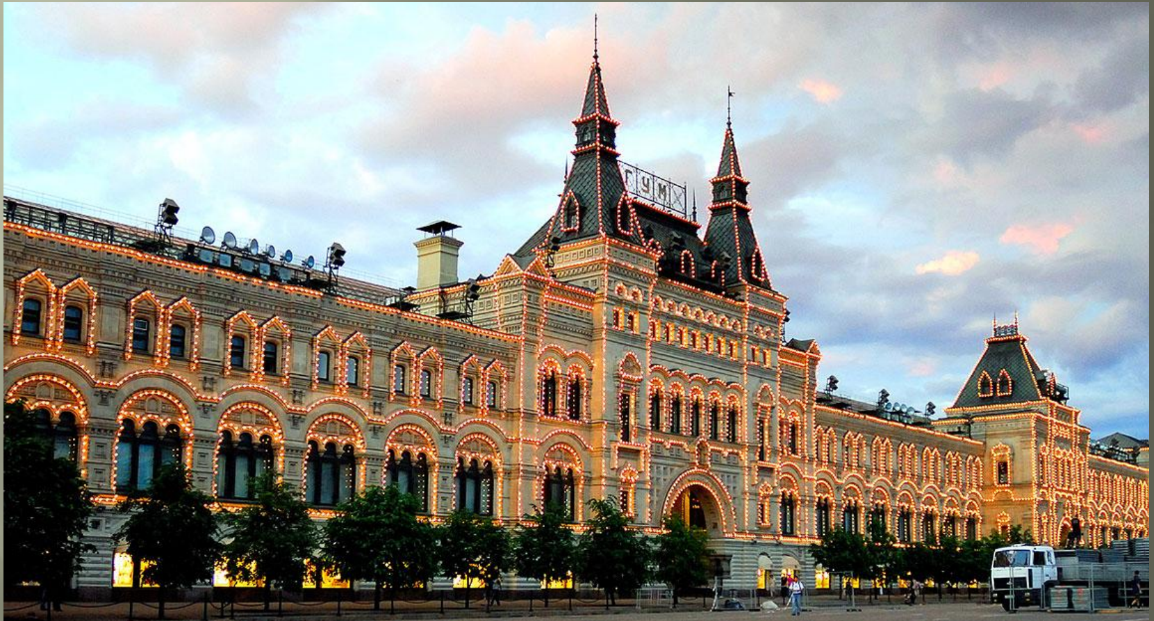
Верхние торговые ряды (ныне здание ГУМа, 1890—1893, архитектор Александр Померанцев)

К началу 1880-х гг. «ропетовщину» сменило новое официальное направление псевдорусского стиля, почти буквально копировавшее декоративные мотивы русской архитектуры XVII в. В рамках данного направления здания, построенные, как правило, из кирпича или белого камня, стали обильно декорироваться в традициях русского народного зодчества. Для этой архитектуры характерны «пузатые» колонны, низкие сводчатые потолки, узкие окна-бойницы, теремообразные крыши, фрески с растительными орнаментами, использование многоцветных изразцов и массивнойковки.