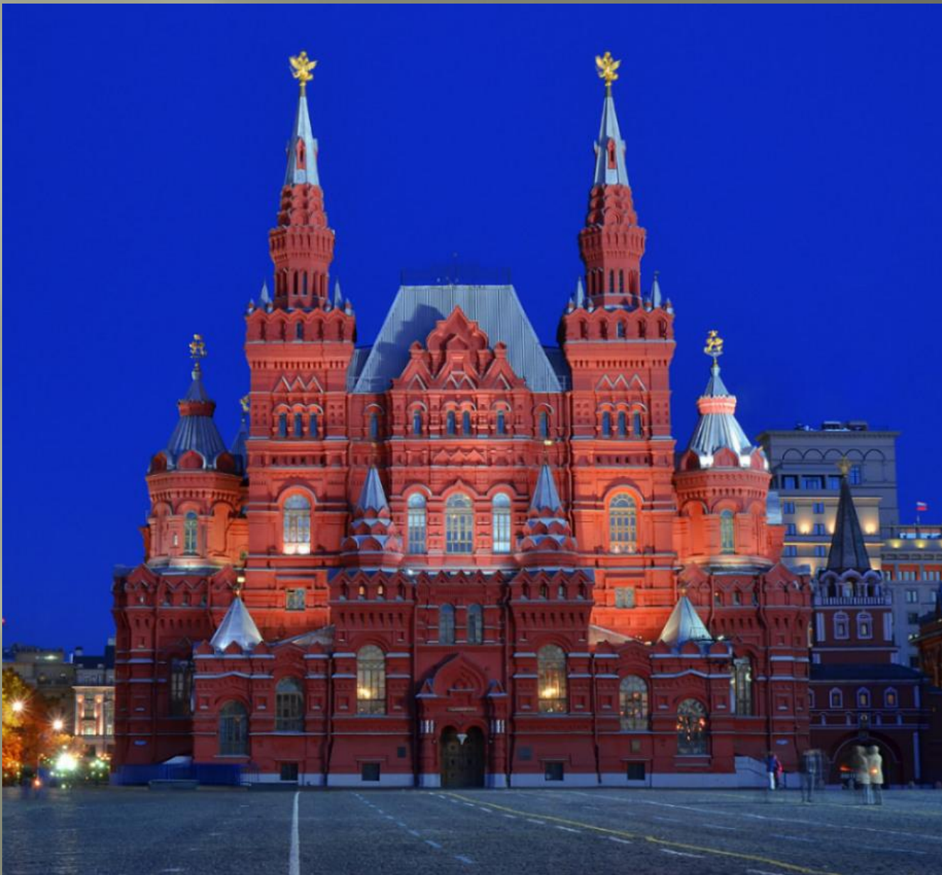
Здание Исторического музея (1875—1881, архитекторы В.О. Шервуд, А.А. Семенов)