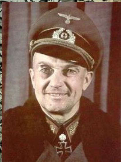
Генерал Герман Гот, командующий 4-й танковой армией, 24-го танкового корпуса и оперативной группой «Кемпф» (группа армий «Юг»)