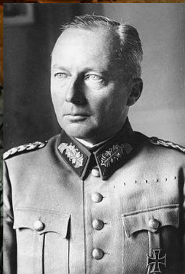
генерал-фельдмаршал Гюнтер Ханс Фон Клюге, группа армий «Центр»