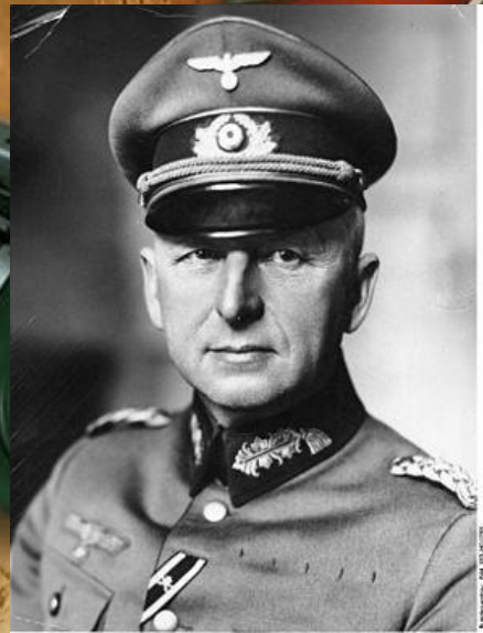
генерал-фельдмаршал Э. Манштейн, группа армий «Юг»