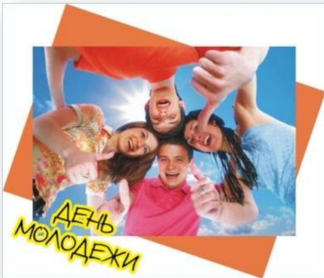
Год молодежи 2009 год