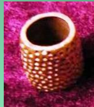
Наперсток изготовлен древним северным народом сихиртя, исчезнувшим вместе с мамонтами