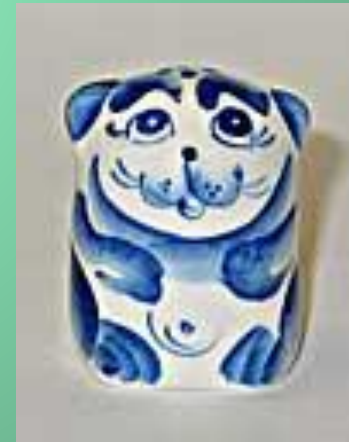
Наперстки Светланы Зубовой