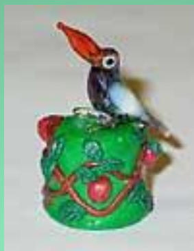
Наперсток из пластика