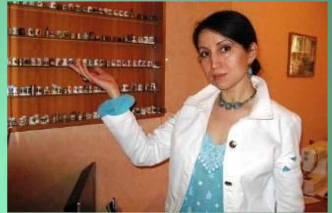
Одна из самых больших коллекций Украины