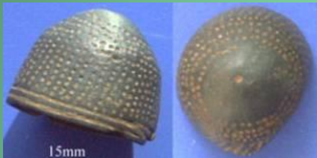
Наперсток найден на территории Германии примерно 1350 год