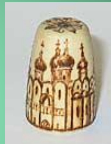
Загорская роспись с выжиганием