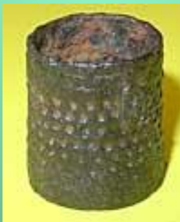
Железный финно-угорский наперсток