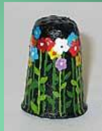
Наперсток из папье-маше