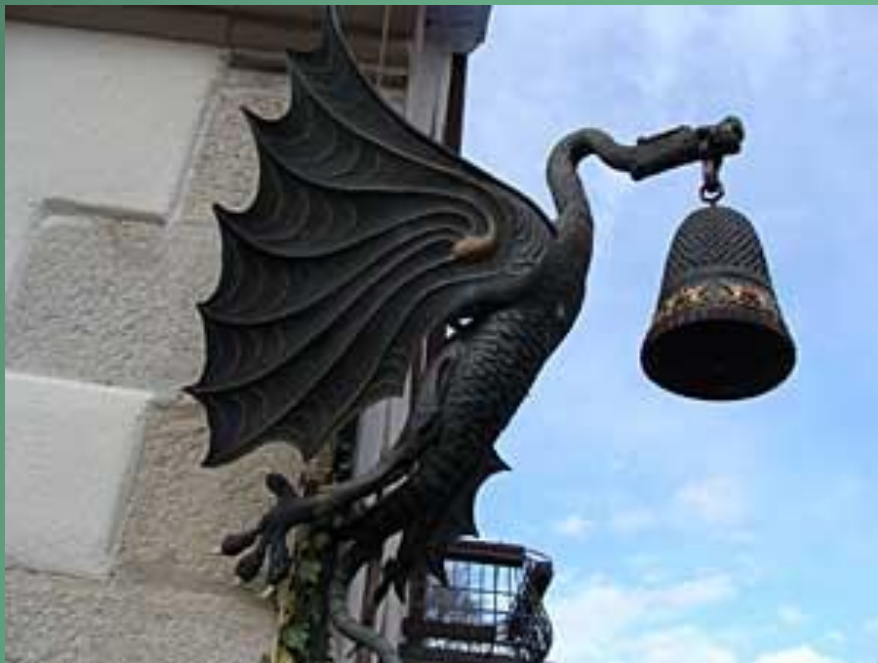
Музей наперстков в Германии