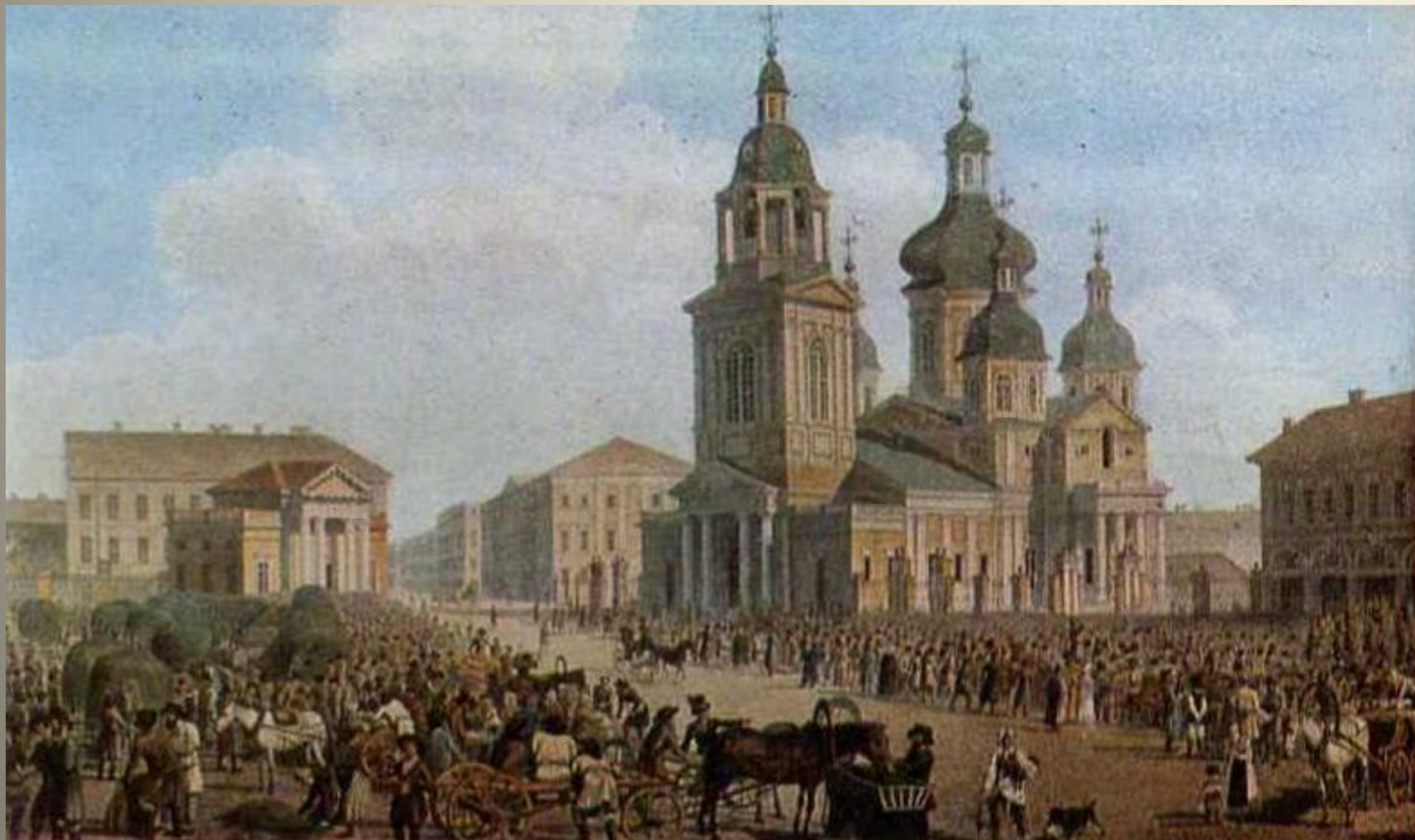
Сенная площадь. Раскрашенная литография А. П. Брюллова. 1822 г.

Жизнь в Петербурге для пришлого мужика начиналась с поиска работы. Существовало несколько “рынков”, где предлагали свои услуги специалисты едва ли не любой профессии. Плотники и каменщики собирались у Сенной площади.