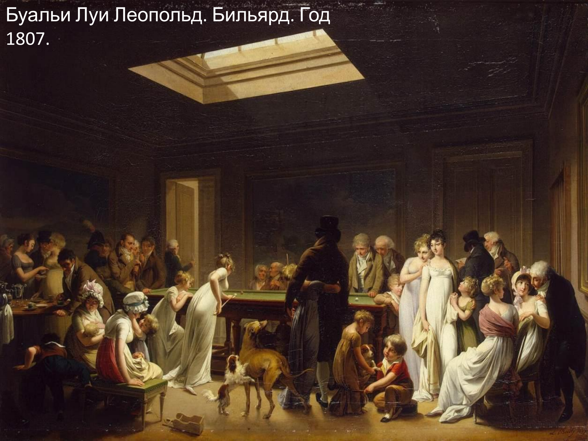
Буалъи Луи Леопольд. Билъярд. Год 1807.