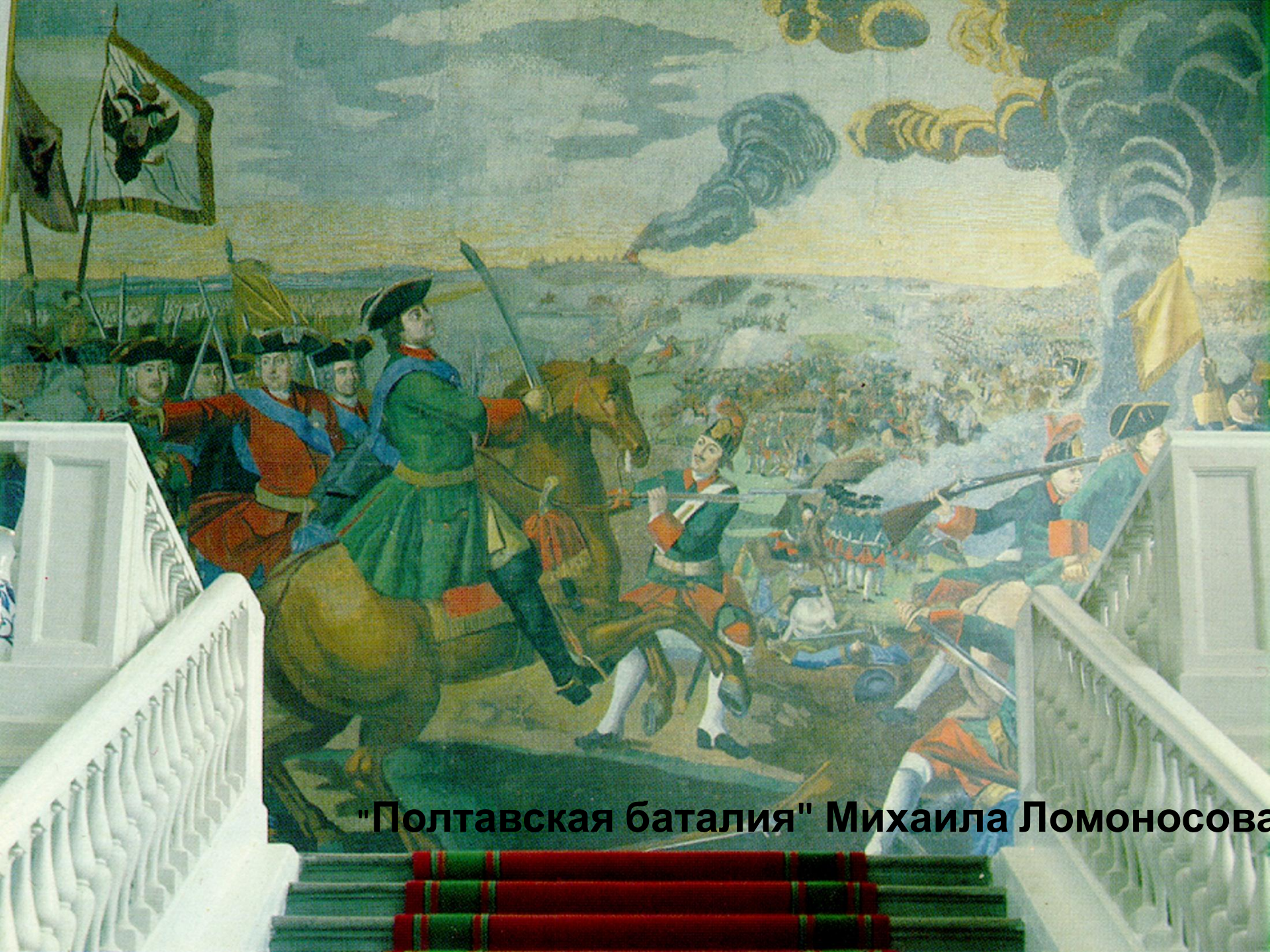
"Полтавская баталия" Михаила Ломоносова