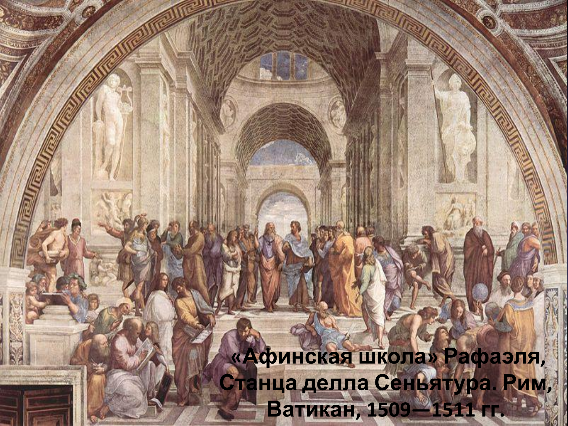
«Афинская школа» Рафаэля, Станца делла Сеньятура. Рим, Ватикан, 1509—1511 гг.