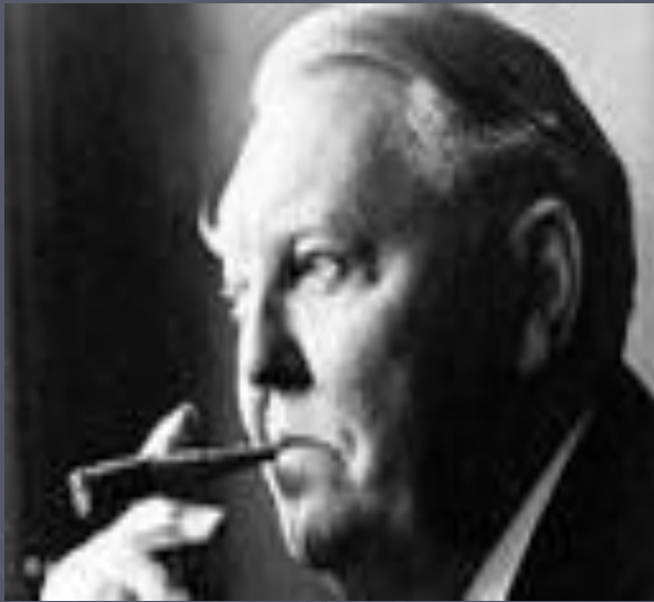
Л. Эрхард. Премьер – Министр ФРГ.