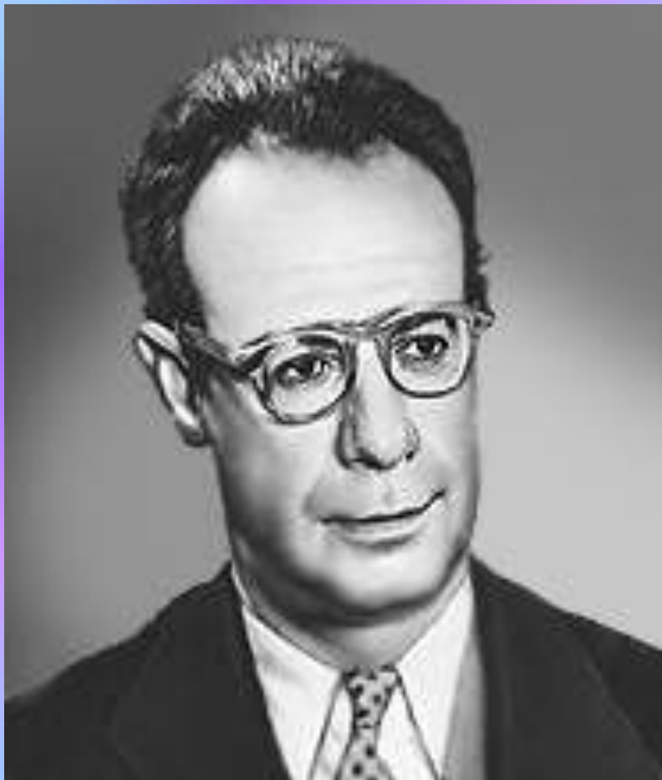
Лев Кассиль 1905 - 1970