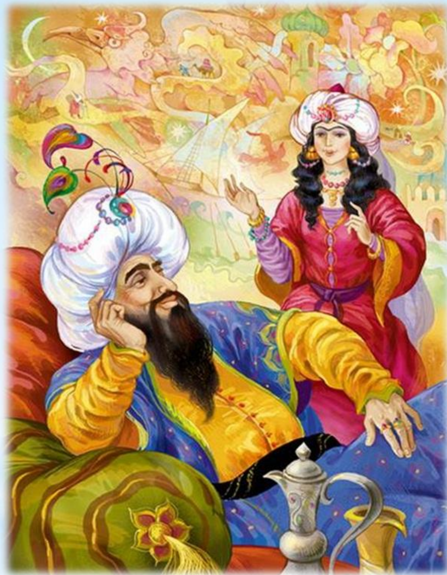
Симфоническая сюита «Шехеразада»