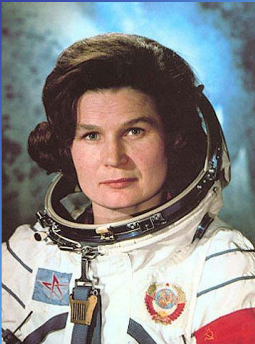
Валентина Терешкова- первая женщина- космонавт