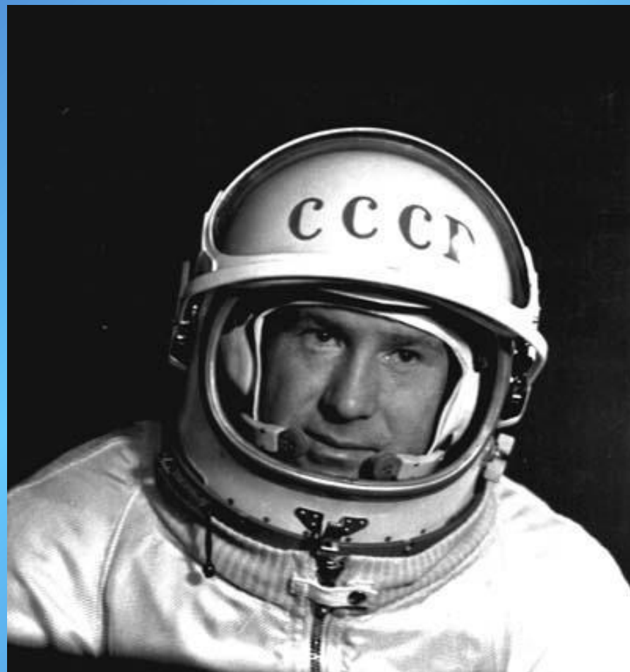
Алексей Архипович Леонов