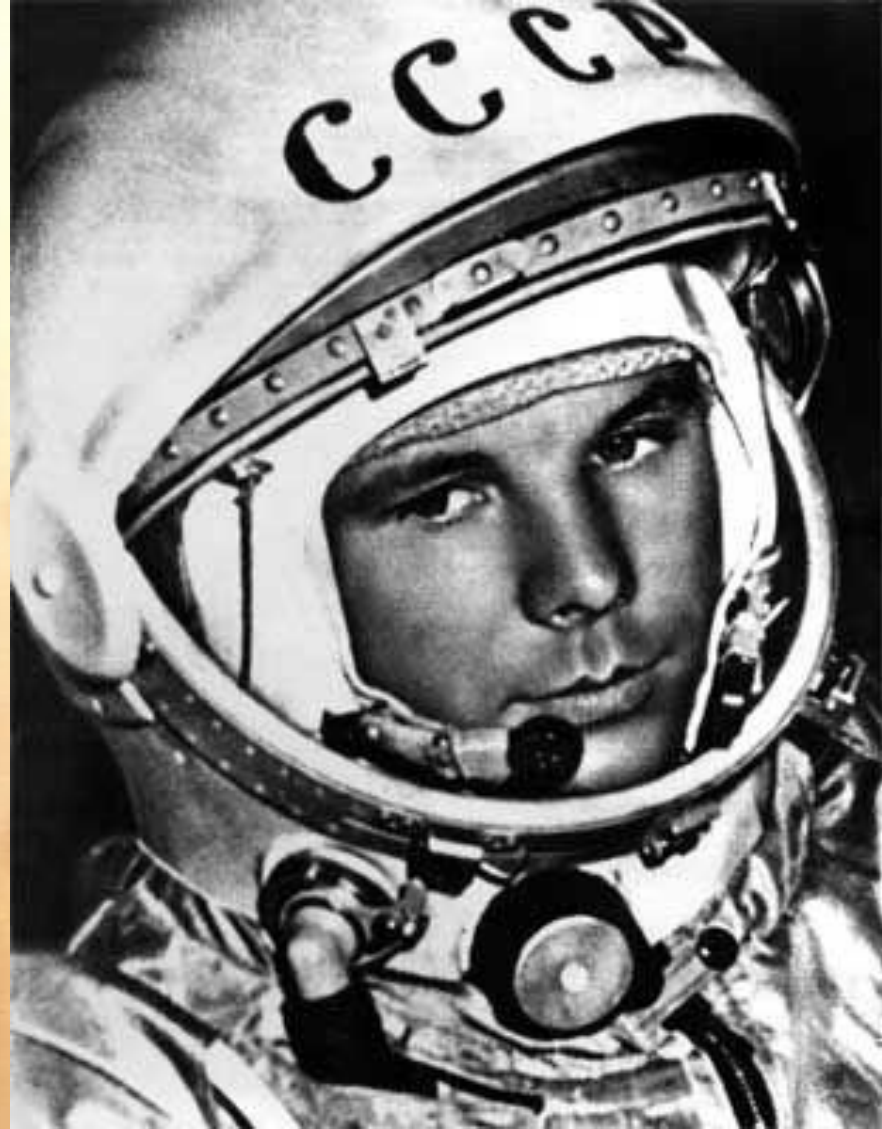
Юрий Алексеевич Гагарин- первый космонавт