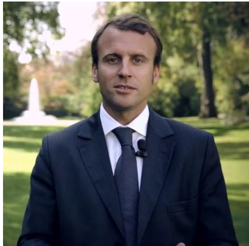
Эммануэль Жан-Мишель Фредерик