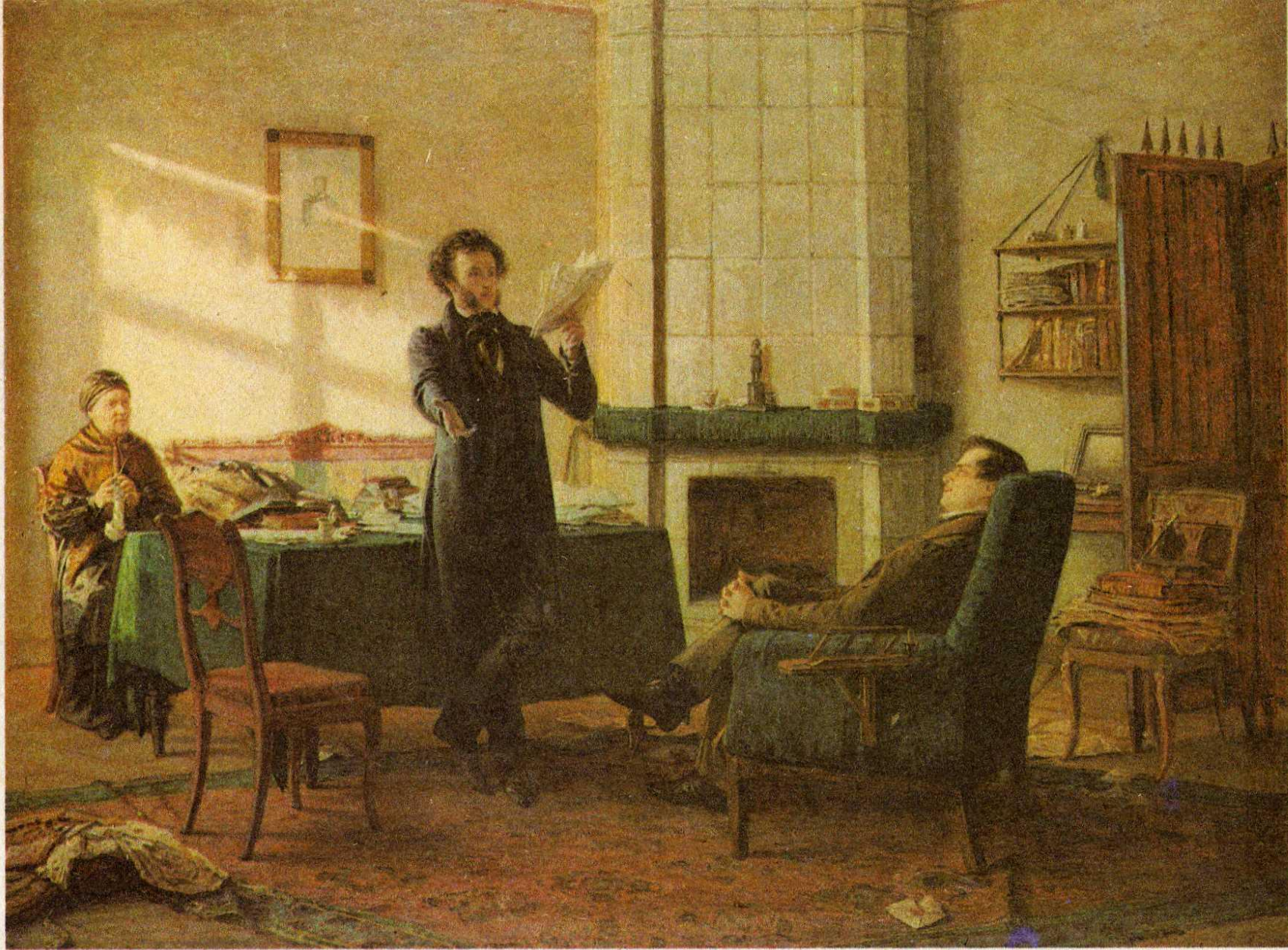
Н. Н. Ге. А. С. Пушкин в селе Михайловском.