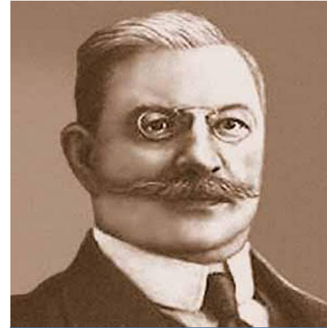
Павел Николаевич Милюков (1859-1943 г.г.)