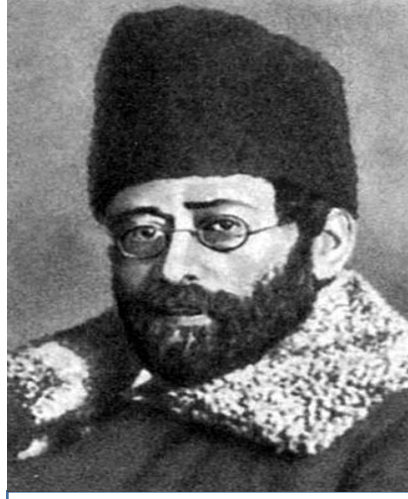
Юлий Осипович Цедербаум (Мартов) (1873-1923 г.г.)