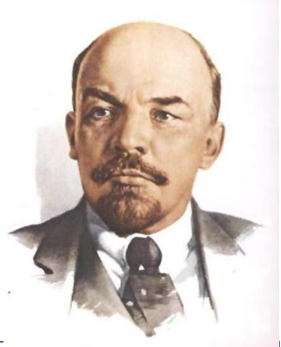
Владимир Ильич Ленин (1870-1924 г.г.)