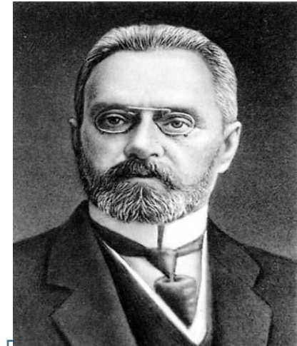
Александр Иванович Гучков (1862-1936 г.г.)