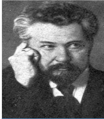
Виктор Михайлович Чернов (1873-1952 г.г.)