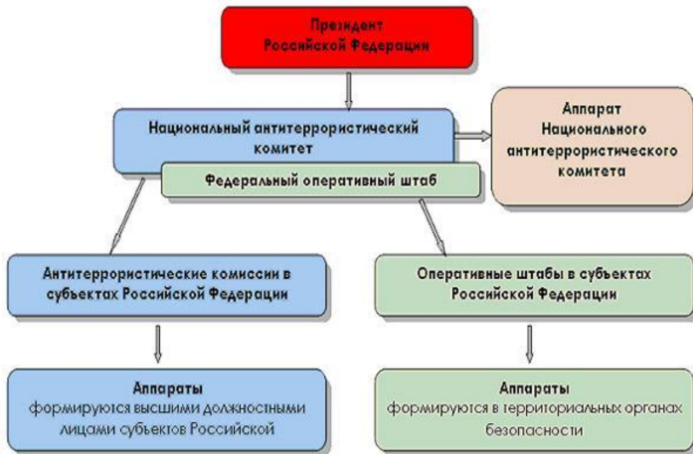
Схема координации деятельности по противодействию терроризму в Российской Федерации