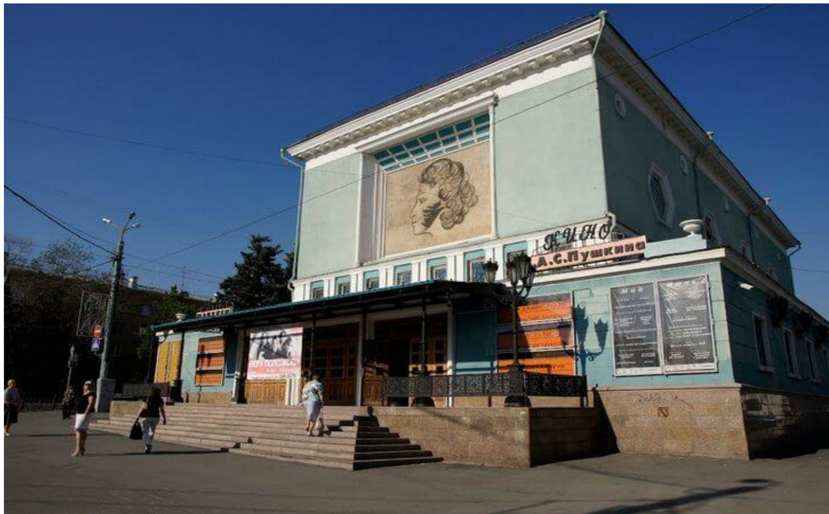
Фото кинотеатра им. А.С.Пушкина