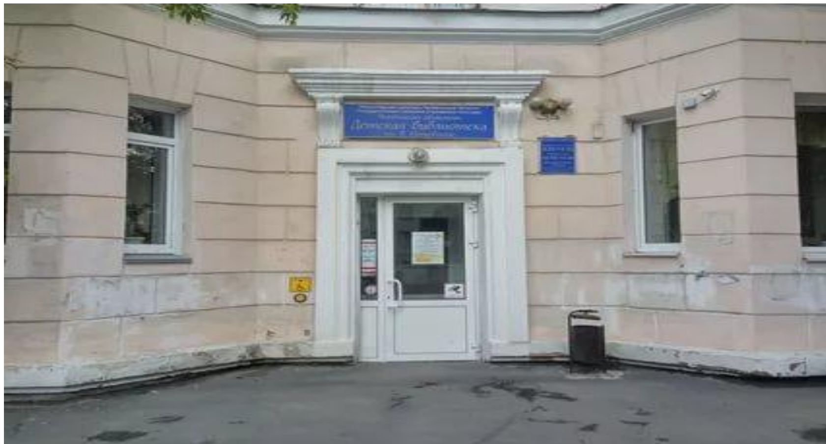
Фото данного места: