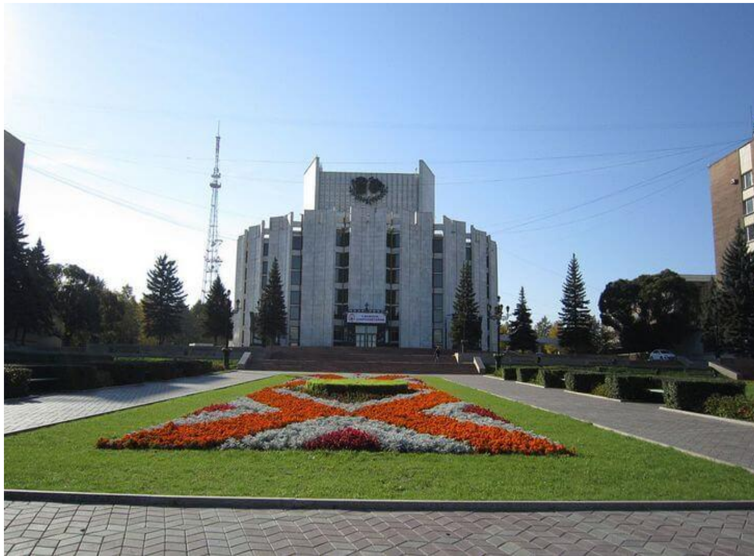
Фото театра драмы имени Наума Орлова