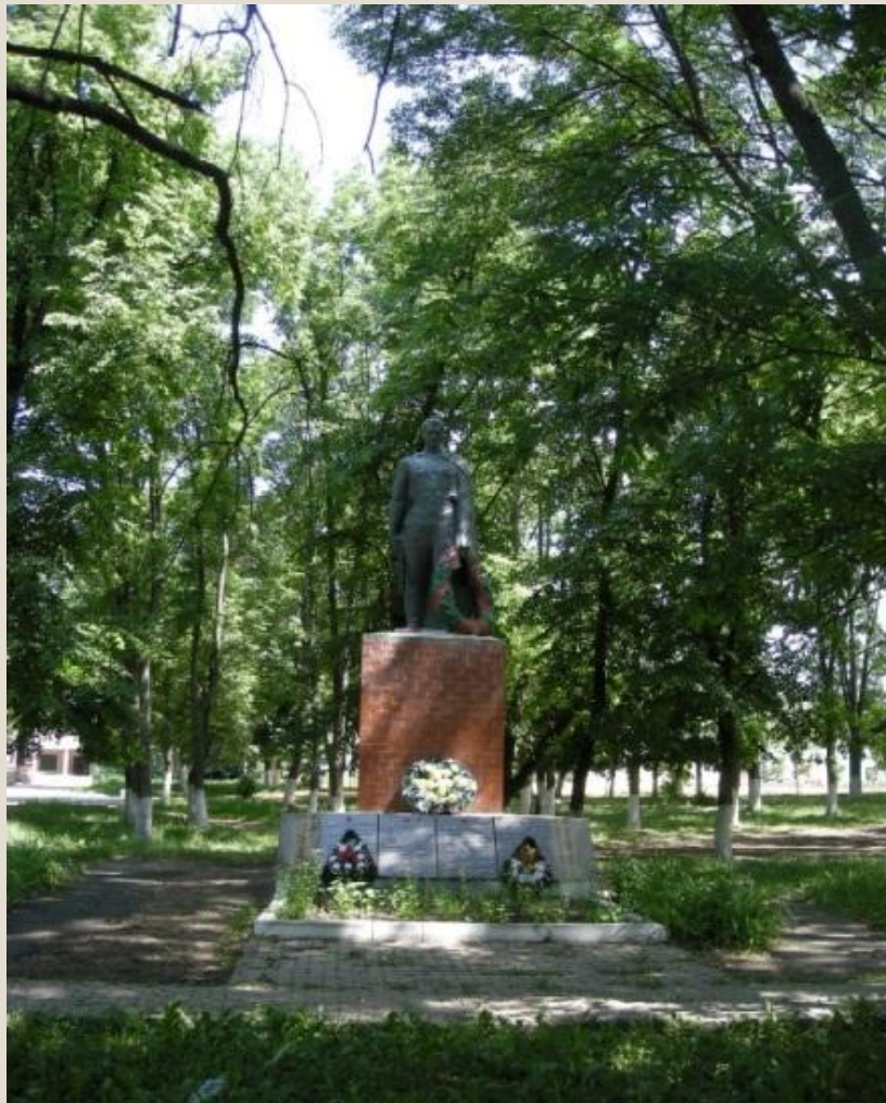
Памятник павшим воинам