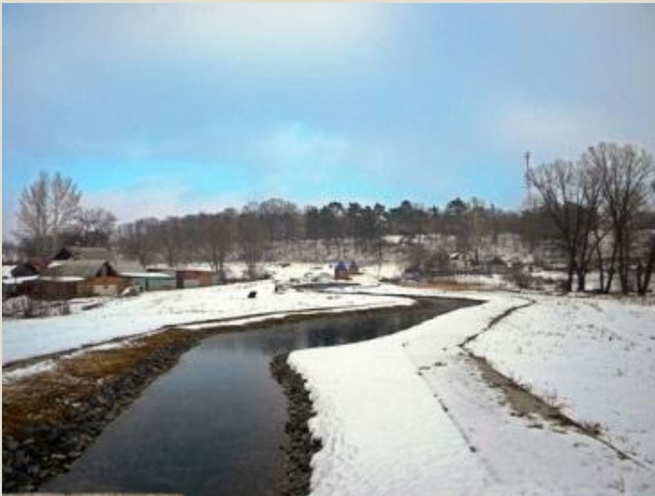
Облик села Большетроицкое