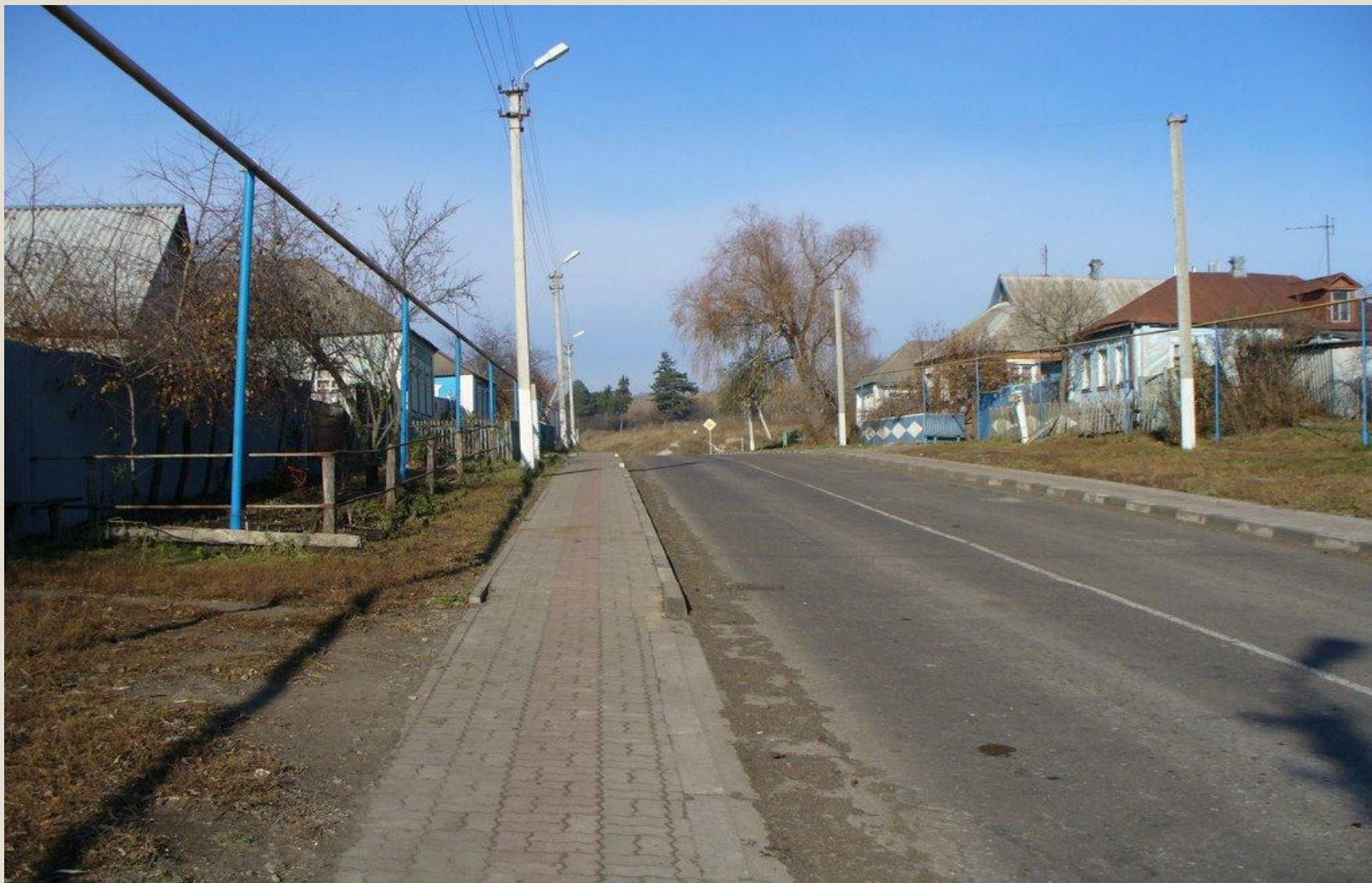
центральная улица нашего села