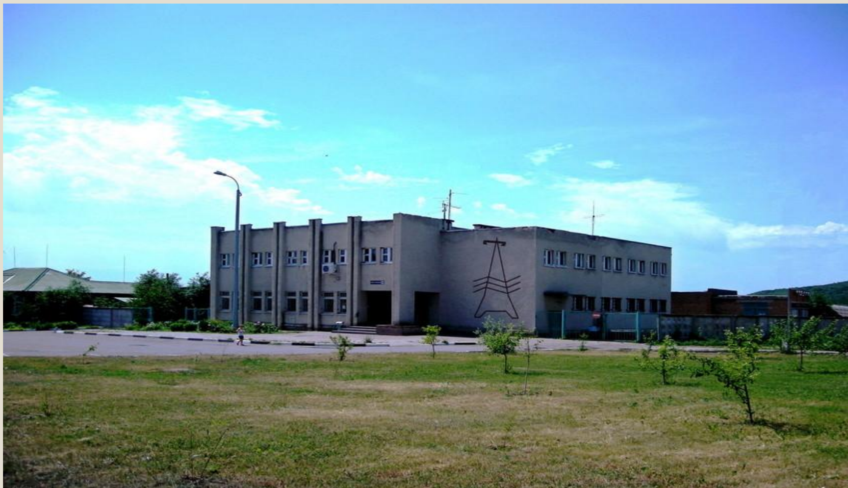
Почтовое отделение села