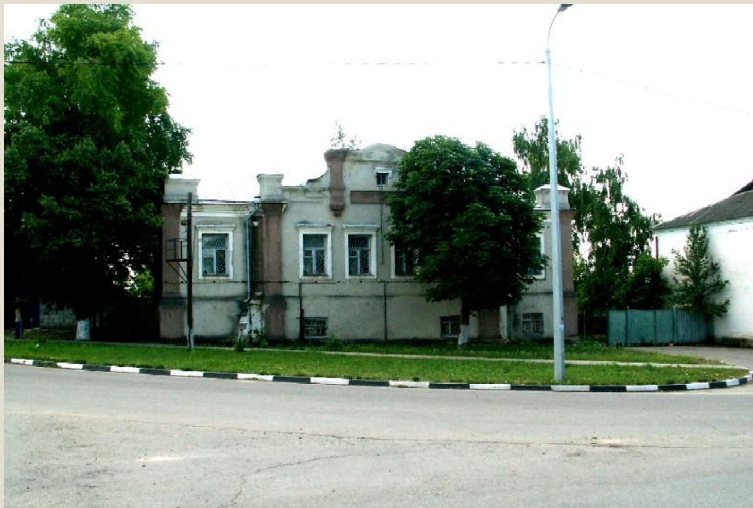
Старое здание сбербанка