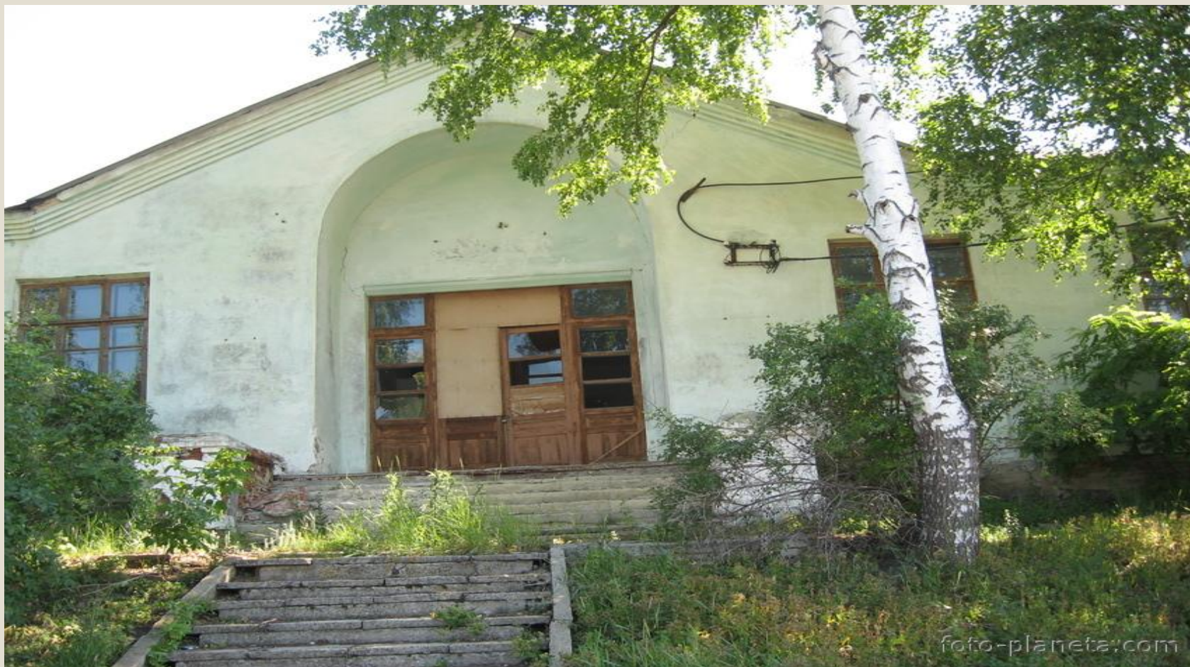
Сельская библиотека бывшая