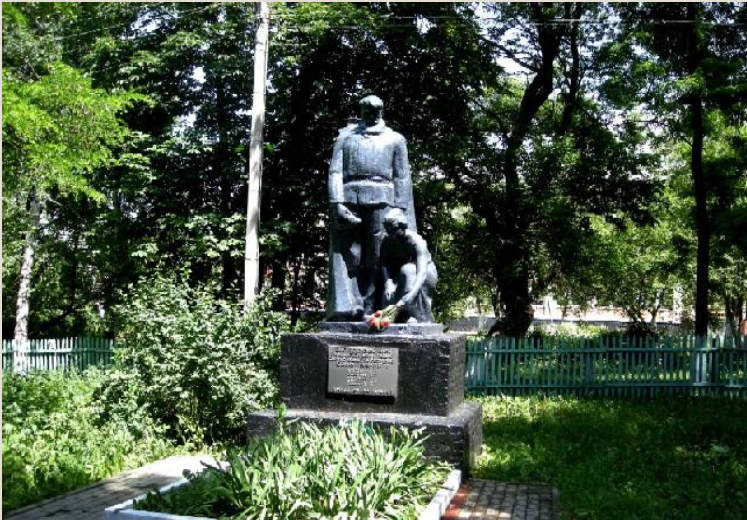
Памятник Воинской Славы