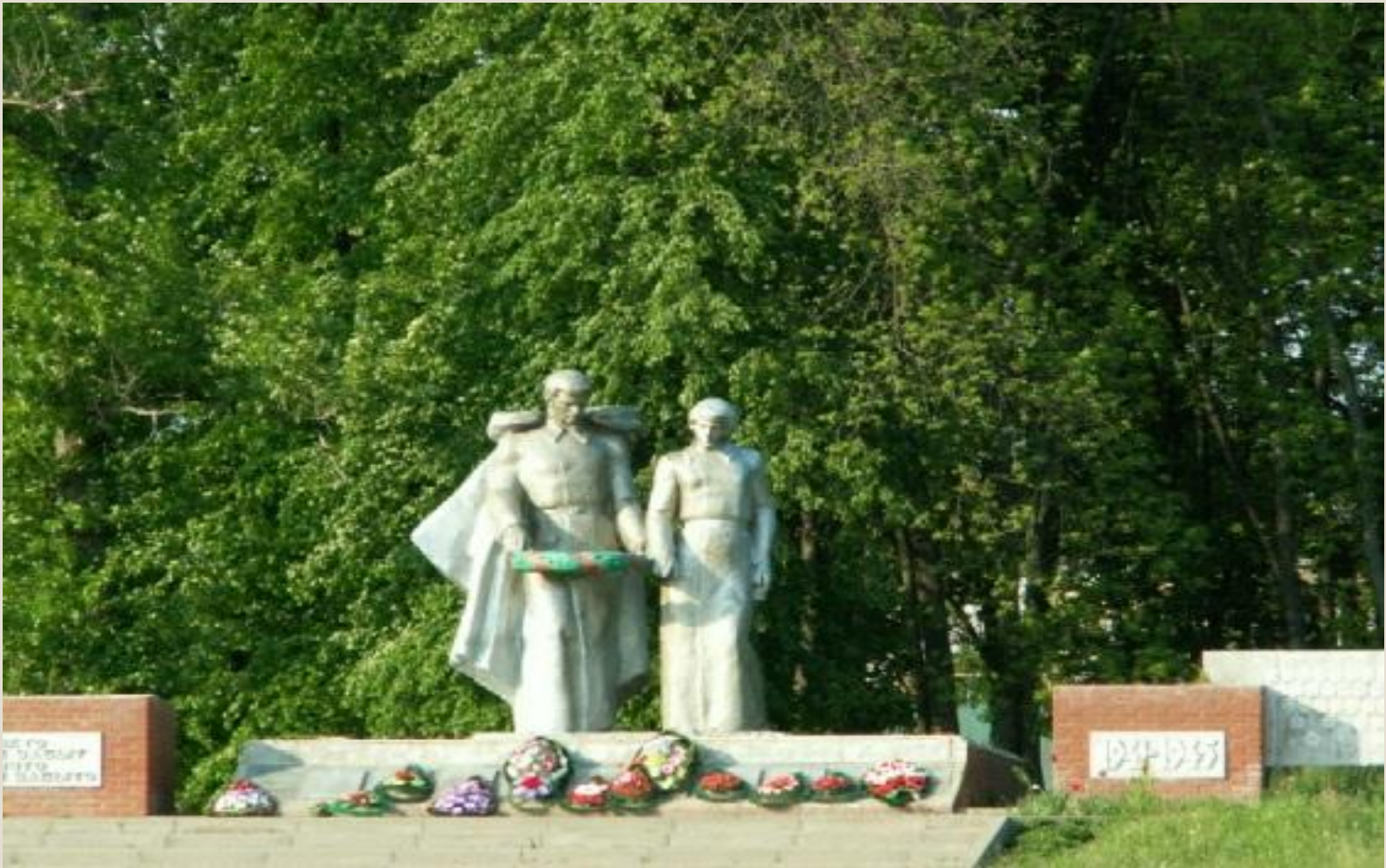
Памятник героям ВОВ