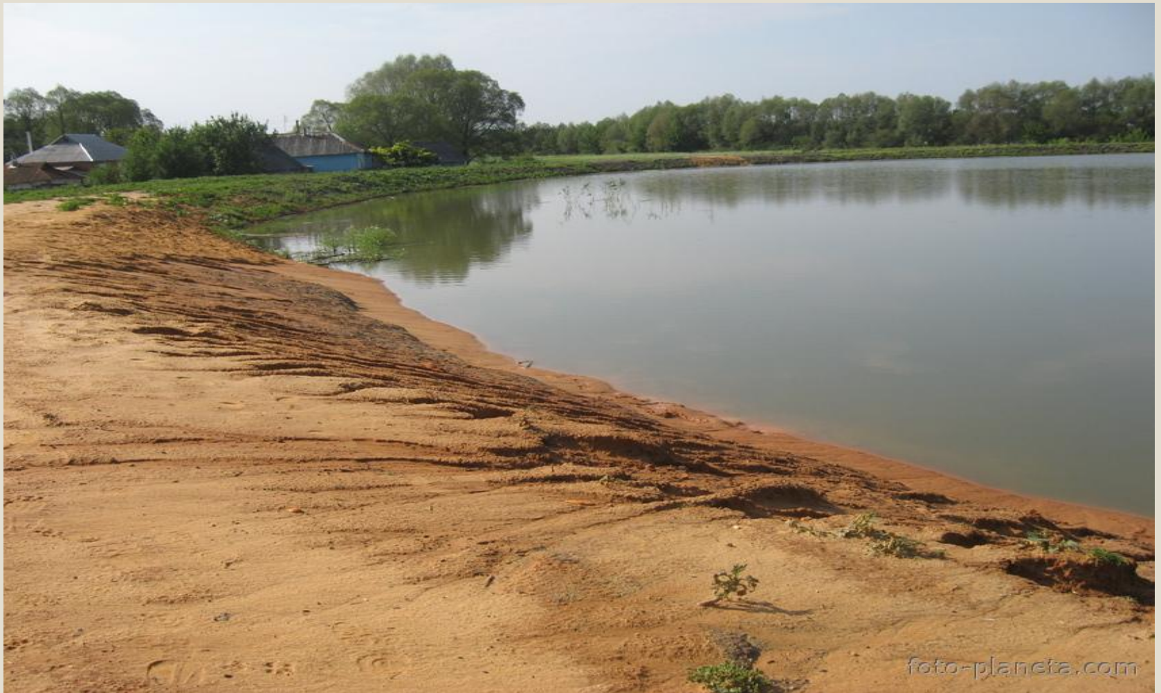
Пруд нашего села