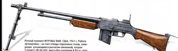
Ручной пулемет M1918A2 BAR, США, 1941 г. Работа автоматики – за счет отвода пороховых газов, запирание – качающимся рычагом-личинкой, патрон 7,62x51.30-06 USI, масса без патронов 9,82 кг, длина – 1 219 мм, огонь – непрерывный, темп стрельбы – 500 выстр./мин, емкость магазина – 20 патронов