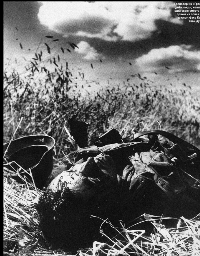
Гренадер из «Гросс-дойчланд», машед-ший самоубийство на одном из полей на южном фланге Кур-ской дуги