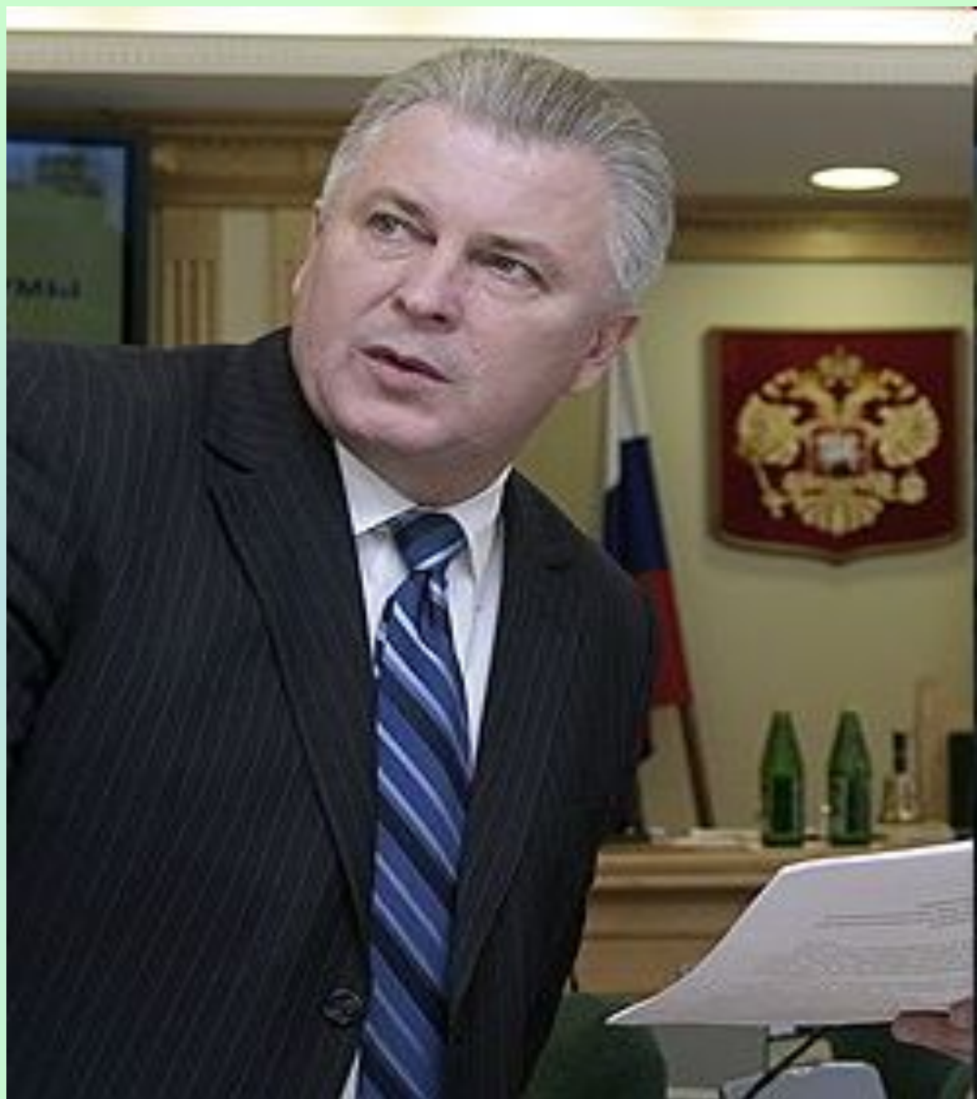
Президент Республики Бурятия- Ноговицын В.В.