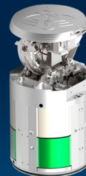
Активная радиолокационная головка самонаведения 9Б-1103М1