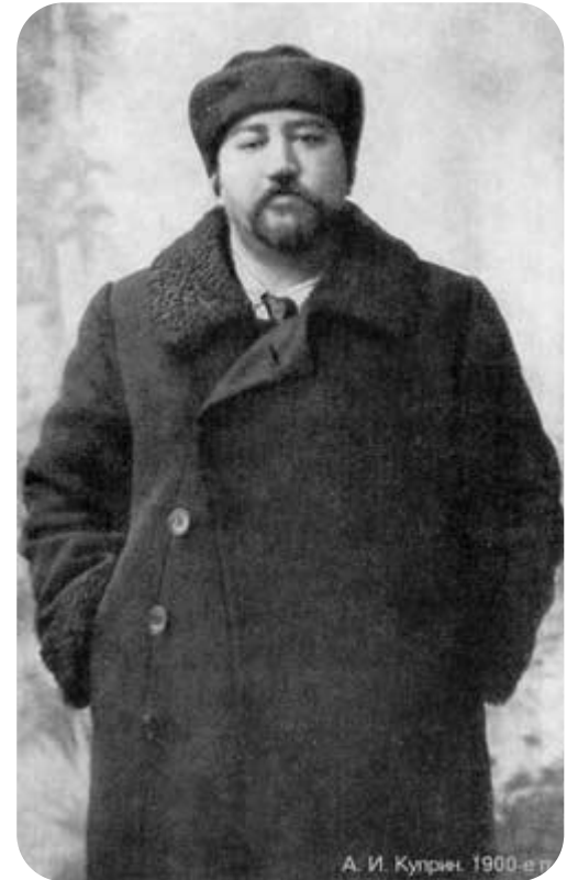
А. И. Куприн. 1900-е гг.

Одно время работает в издательстве "Всемирная литература", основанной Горьким.